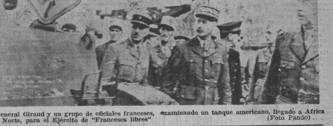
El general Giraud y un grupo de oficiales franceses, examinando un tanque americano, llegado a Africa del Norte, para el Ejército de «Franceses Libres»

Material americano para el ejército de «franceses libres»