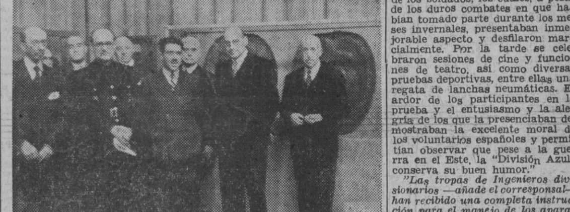
El ministro de Educación Nacional, camarada Ibañez Martín, inaugura en el Salón de Amigos del Arte, de Madrid, una Exposición de cordobanes y guadamecés.