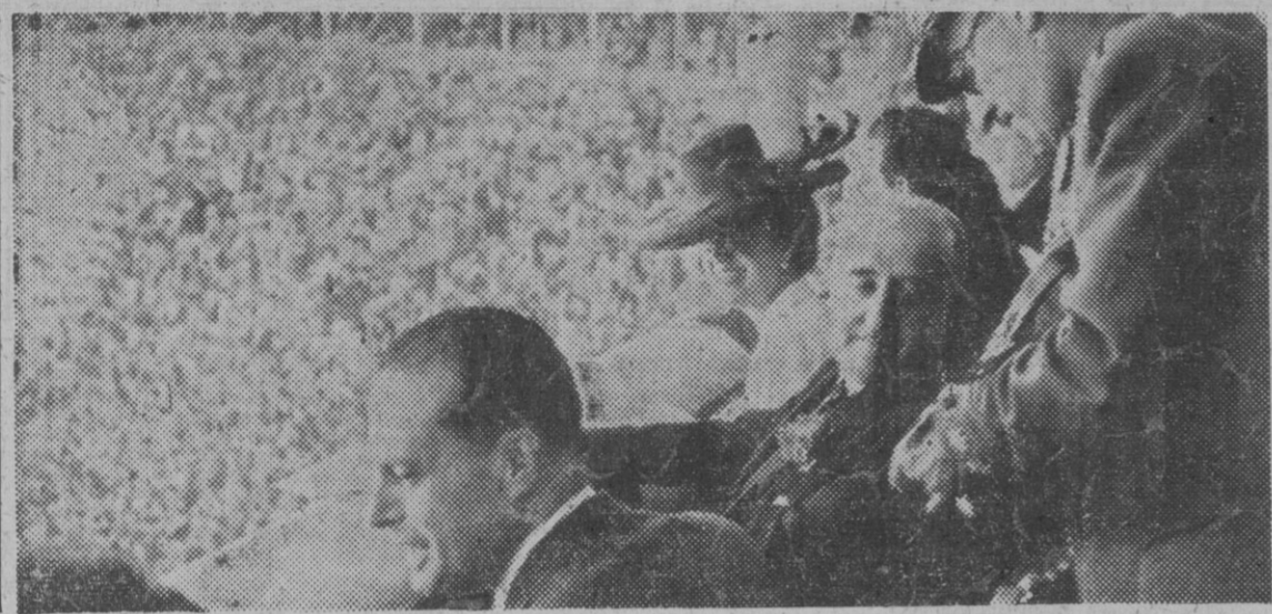
El Caudillo, acompañado de su esposa y del ministro de la Gobernación, camarada Blas Pérez, presidente de la corrida celebrada en Madrid, a beneficio del Hospital Provincial.