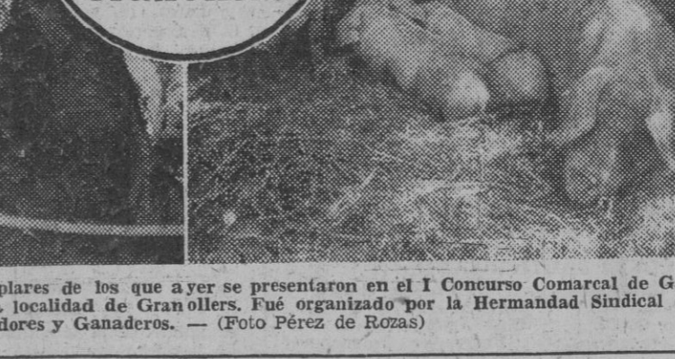
He aquí cuatro valiosísimos ejemplares de los que ayer se presentaron en el I Concurso Comarcal de Ganados, que se celebró en la vecina localidad de Granollers. Fue organizado por la Hermandad Sindical de Labradores y Ganaderos.

Fiesta de final de curso de los alumnos de la Escuela de Ingenieros Industriales Mañana, sábado, a las cinco de la tarde, tendrá lugar la fiesta anual de fin de curso de los estudiantes de Ingenieros, en los jardines de la Rosaleda.