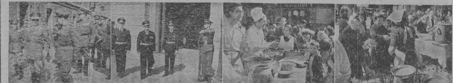
1. El excelentísimo señor general Moscardó, jefe de la IV Región Militar, presenciando el desfile de las fuerzas del IV Grupo de Automóviles, cuyo cuartel ha visitado. — 2. El nuevo cónsul general de Alemania acompañado del cónsul saliente, doctor Jaeger, y del viccónsul, saliendo de Capitanía de cumplimiento al general Moscardó. — 3 y 4. Dos aspectos de la tradicional venta callejera conmemorativa de la festividad de San Poncio. — (Fotos Pérez de Rozas)