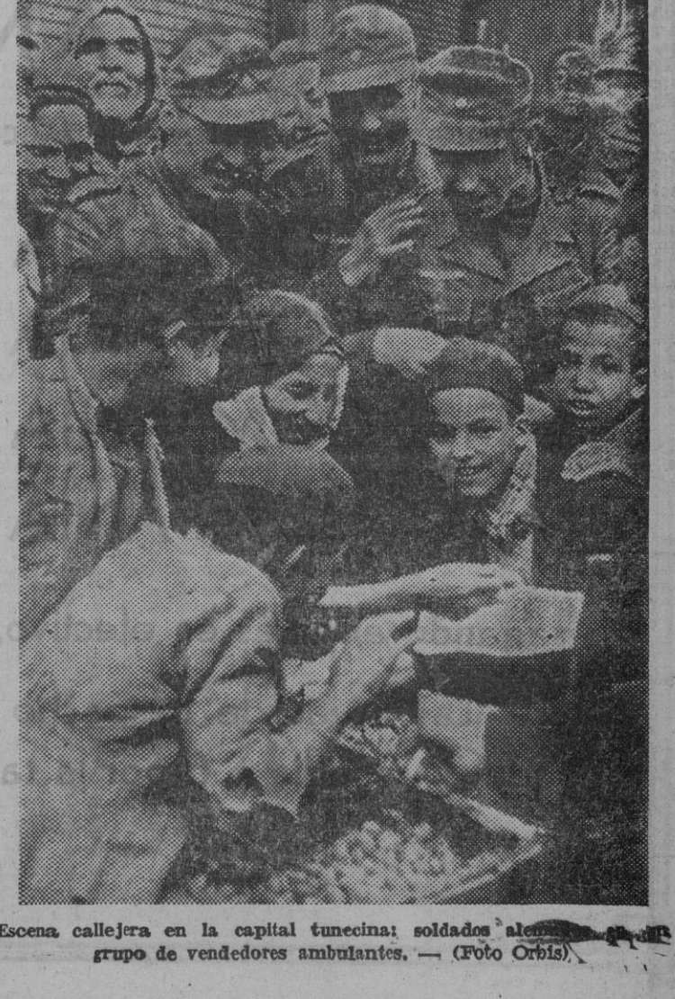
Escena callejera en la capital tunecina; soldados alemanos y grupo de vendedores ambulantes.