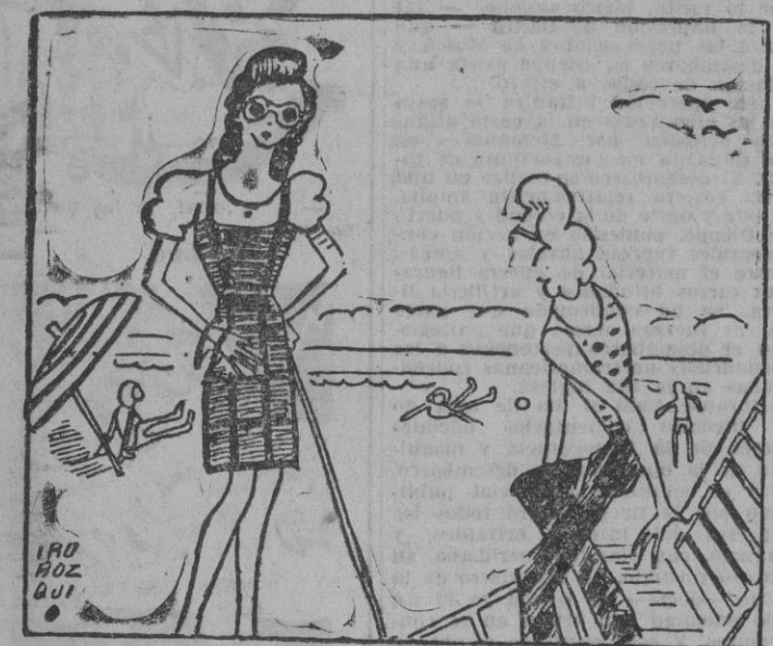
—Imaginate que en esta playa desembarcasen los ingleses y norteamericanos. ¿Tú qué harías?... —Mirar a ver si entre los norteamericanos venía Robert Taylor.