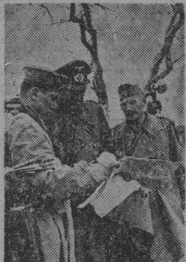
Los generales Busch y Meyer, examinando un mapa, durante una de las recientes operaciones