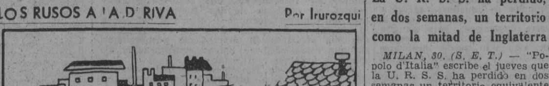
«¿Qué le parece el avance por el Don? ¿Por el Don? ¡Excelentísimo!»