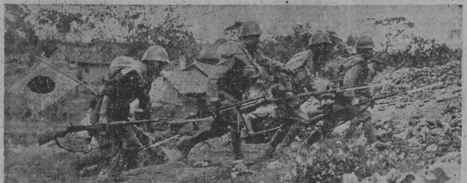
Infantería japonesa de desembarco lanzándose al ataque inmediatamente después de poner pie en tierra firme.