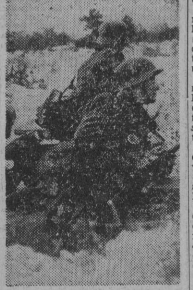
«Hay que conquistar aquella posición», ha dicho el Mando, y estos soldados esperan la orden para lanzarse al asalto