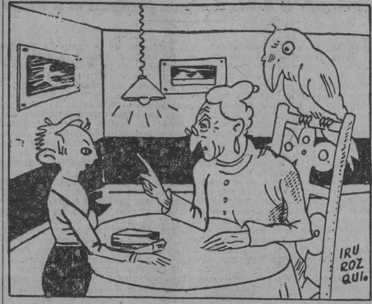
—Oye, abuelita, ¿es cierto que hablan mucho los loros? —No, Jaimito. Quienes hablan son los "loros".