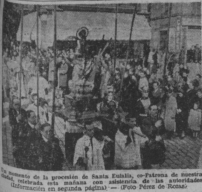
Un momento de la procesion de Santa Eulalia, co-Patrona de nuestra ciudad, celebrada esta mañana con asistencia de las autoridades (Información en segunda página).