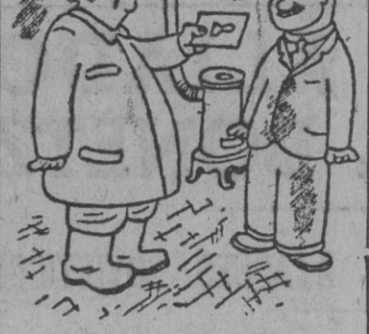
Stalin: — Mira, el rey de Inglaterra me ha dedicado su retrato.