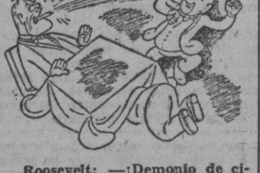
Roosevelt: — ¡Demonio de cigarro! Parece un producto japonés. ¡Estalla cuando menos te lo esperas!