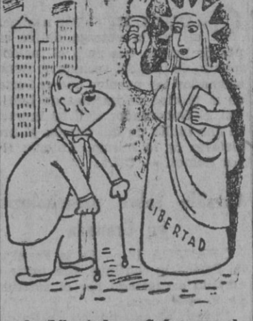
La Libertad: — ¡Señor, uno de nosotros dos está aquí de más!