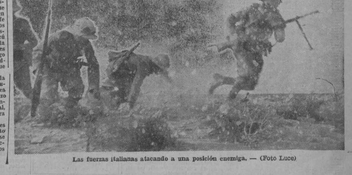
Las fuerzas italianas atacando a una posición enemiga.