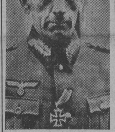
Ofrecemos a nuestros lectores la primera foto del héroe jefe de la "División Azul", general Muñoz Grande, con la Cruz de Hierro alemana, concedida por el Führer por su comportamiento heroico y el de sus fuerzas en la lucha contra el comunismo.