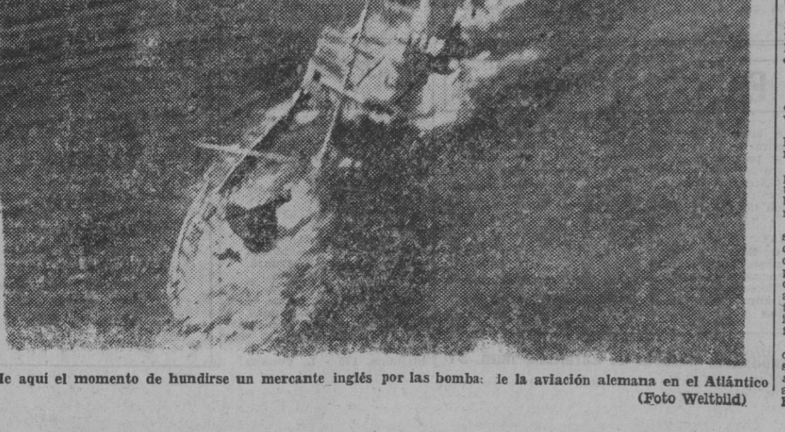
He aquí el momento de hundirse un mercante inglés por las bombas de la aviación alemana en el Atlántico.