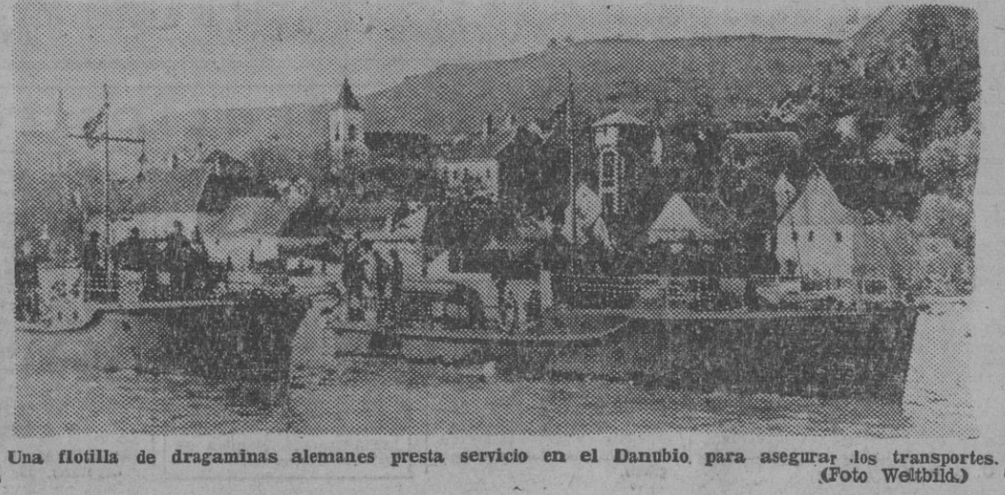
Una flotilla de dragaminas alemanes presta servicio en el Danubio para asegurar los transportes.