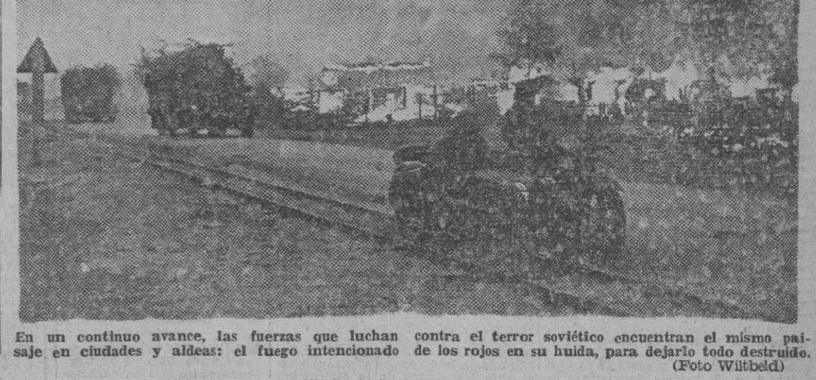
En un continuo avance, las fuerzas que luchan contra el terror soviético encuentran el mismo paisaje en ciudades y aldeas: el fuego intencionado de los rojos en su huida, para dejarlo todo destruido.