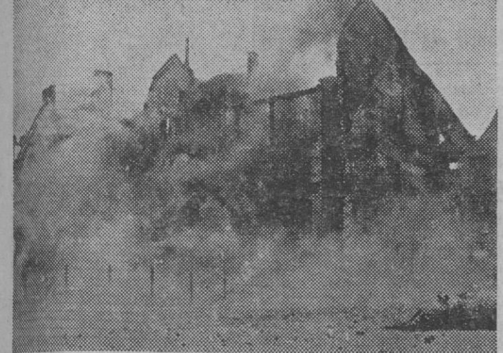
He aquí lo que encontraron las fuerzas alemanas a su entrada en la ciudad de Riga.

Berlín, 31. — Las declaraciones del Ministro de Asuntos Exteriores de España, señor Serrano Suñer, al corresponsal del diario italiano "Il Messaggero" en Madrid, han despertado enorme interés en los círculos políticos de Berlín. Se declara que el señor Serrano Suñer ha puesto una vez más de relieve la comunidad de destino de los pueblos que constituyen la Península Ibérica. También se afirma que estas declaraciones están destinadas a causar sensación e inmejorable impresión entre los países iberoamericanos. — Efe.