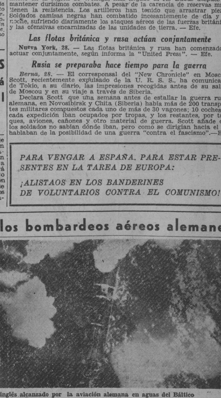
Un buque mercante inglés alcanzado por la aviación alemana en aguas del Báltico

La eficacia de los bombardeos aéreos alemanes