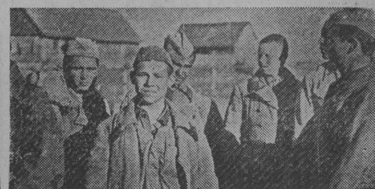
Los primeros prisioneros rojos.