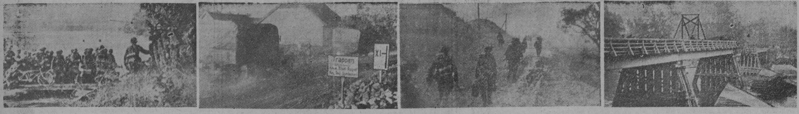
Tropas alemanas cruzando un río fronterizo