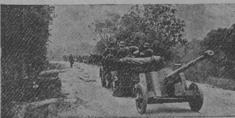
Al amanecer, los alemanes pasan la frontera