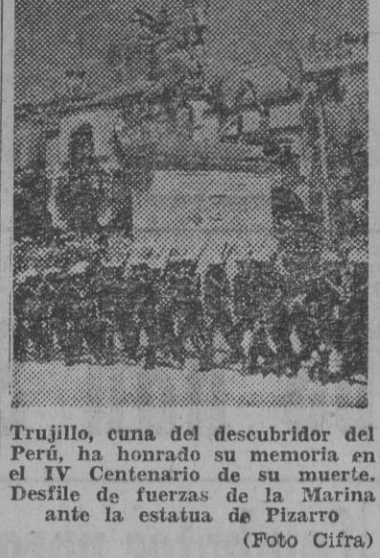
Trujillo, cuna del descubridor del Perú, ha honrado su memoria en el IV Centenario de su muerte.