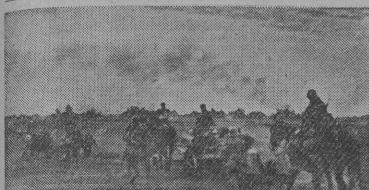
Columnas alemanas durante el avance