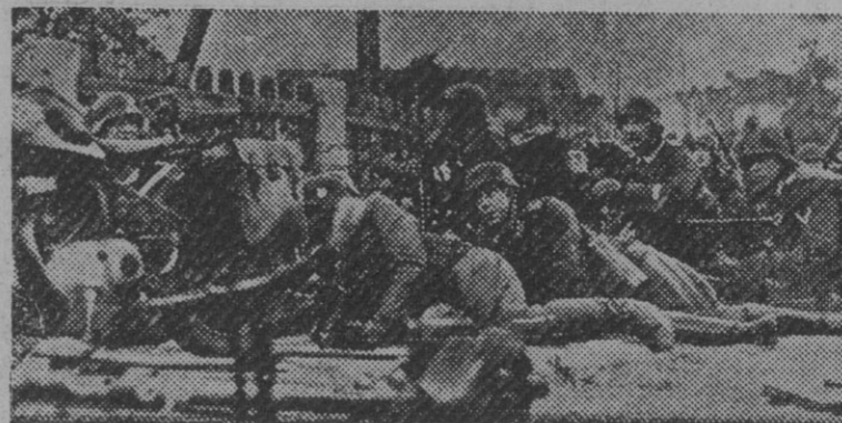
Ciclistas y artillería vencen los primeros obstáculos rusos