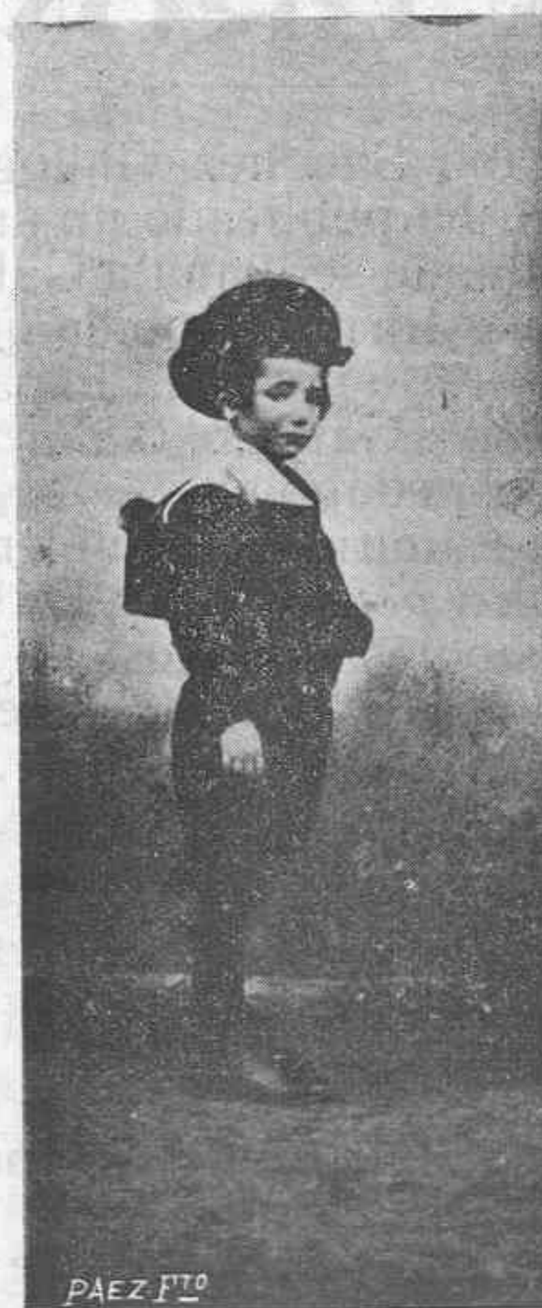
Colegial modernista preparado para una excursión.

Hemos visto sus cuadernos escritos, únicos libros de estudio; sus dibujos; sus trabajos manuales; todo ello natural y defectuoso al principio, pero que poco á poco, con rapidez pasmosa, va perfeccionándose, en progre-