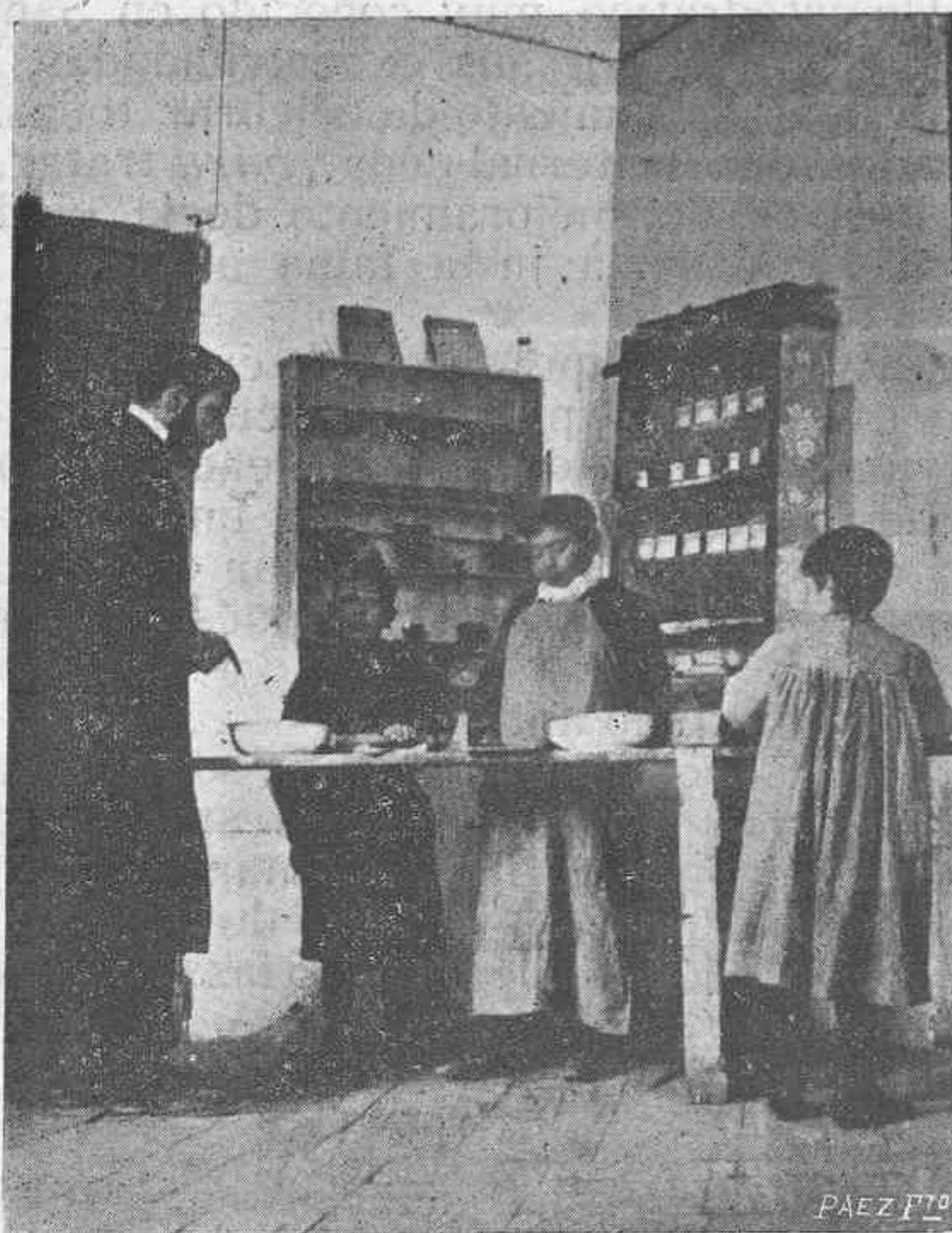
En el taller de trabajos manuales.

Hay, aquí mismo, en Salamanca, sin que lo sepa mucha gente, un colegio de niños montado según los adelantos que esta clase de establecimientos tienen en el extranjero.