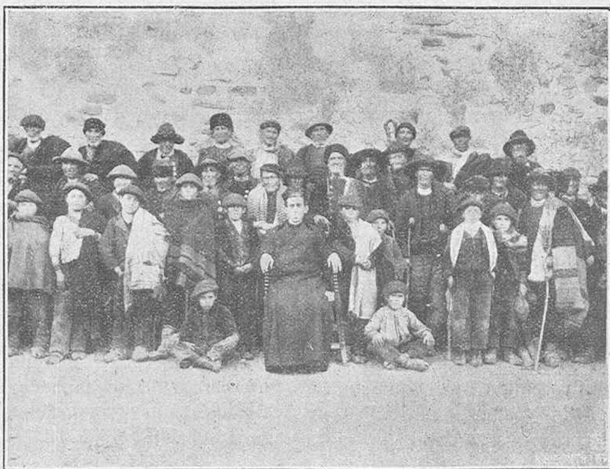
Grupo de hombres ejercitantes.

No tendrás un céntimo, te conozco bien; pero tienes amor y esperanza y fe; eso te basta: saldrás airoso, aunque sea muchas veces rumiando sinsabores y llamando a puertas que no se abren. Pero tu constancia la premiará el Señor, como El sabe hacerlo y moverá el corazón de almas buenas y pudientes, para que te ayuden en la caritativa empresa de