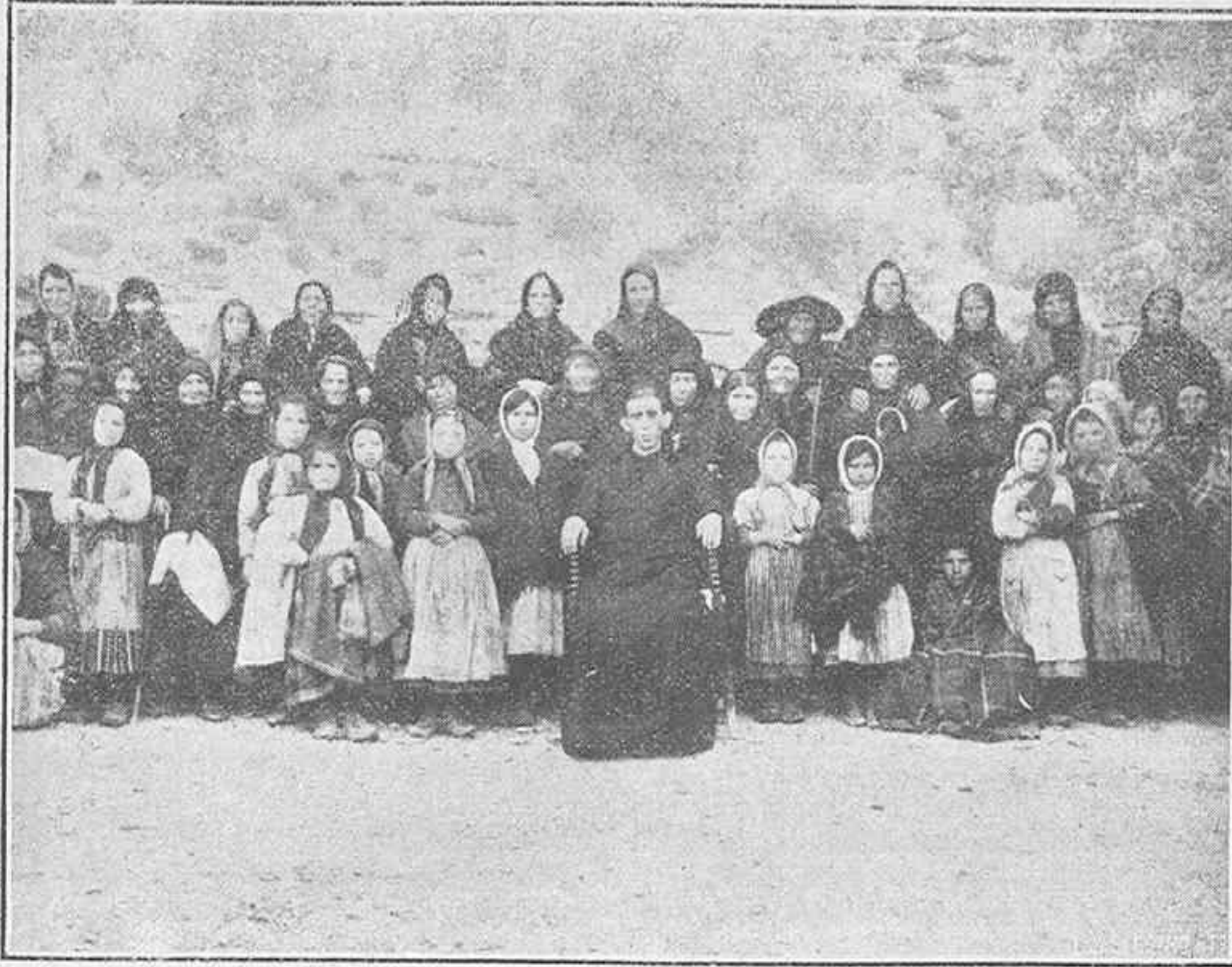
Grupo de mujeres ejercitantes.

Hay un banco desconocido en el mundo de los negocios, pero de una reputación y crédito muy por cima de todas las entidades bancarias que se conocen, de un capital inabordable a todos los guarismos, de un interés y utilidad incalculable y superable a toda humana ambición, cuyos accionistas son legión incontable, su garantía inmovible a todos los fracasos y la inversión del dinero de una utilidad tan asombrosa, que el mundo entero ha tenido que doblegarse y rendirse ante las maravillas y prodigios de su actuación. Se llama Banco de la Caridad . Sus libros de ingresos y registros están en el mismo Cielo. Su director es el mismo Dios. Además del oro y plata pueden los accionistas ingresar toda clase de alhajas y joyas; que en las catorce taquillas de la Misericordia se cotizan a gran valor. Por eso sólo son accionistas los Misericordiosos. Los usufructuarios del capital son los pobres. De noche y de día está en funciones; cada limosna