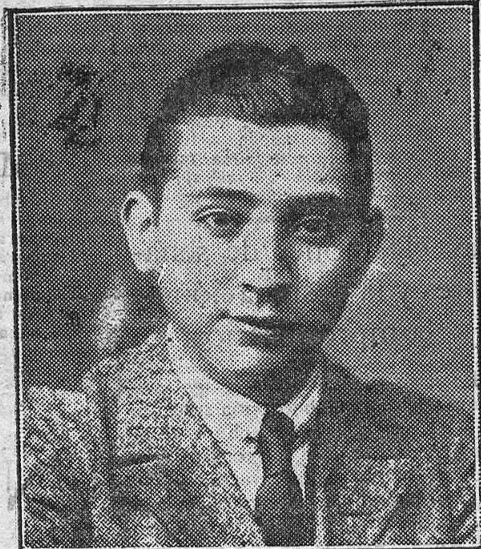
MANUEL JIMENEZ (CHICUELO)

enérgicamente por amor a la justicia, y por creer que así interpreto el sentir de mis compañeros los maestros nacionales, que no quieren ser ingratos para con los hombres políticos que algo han hecho en bien del magisterio y de la enseñanza primaria.