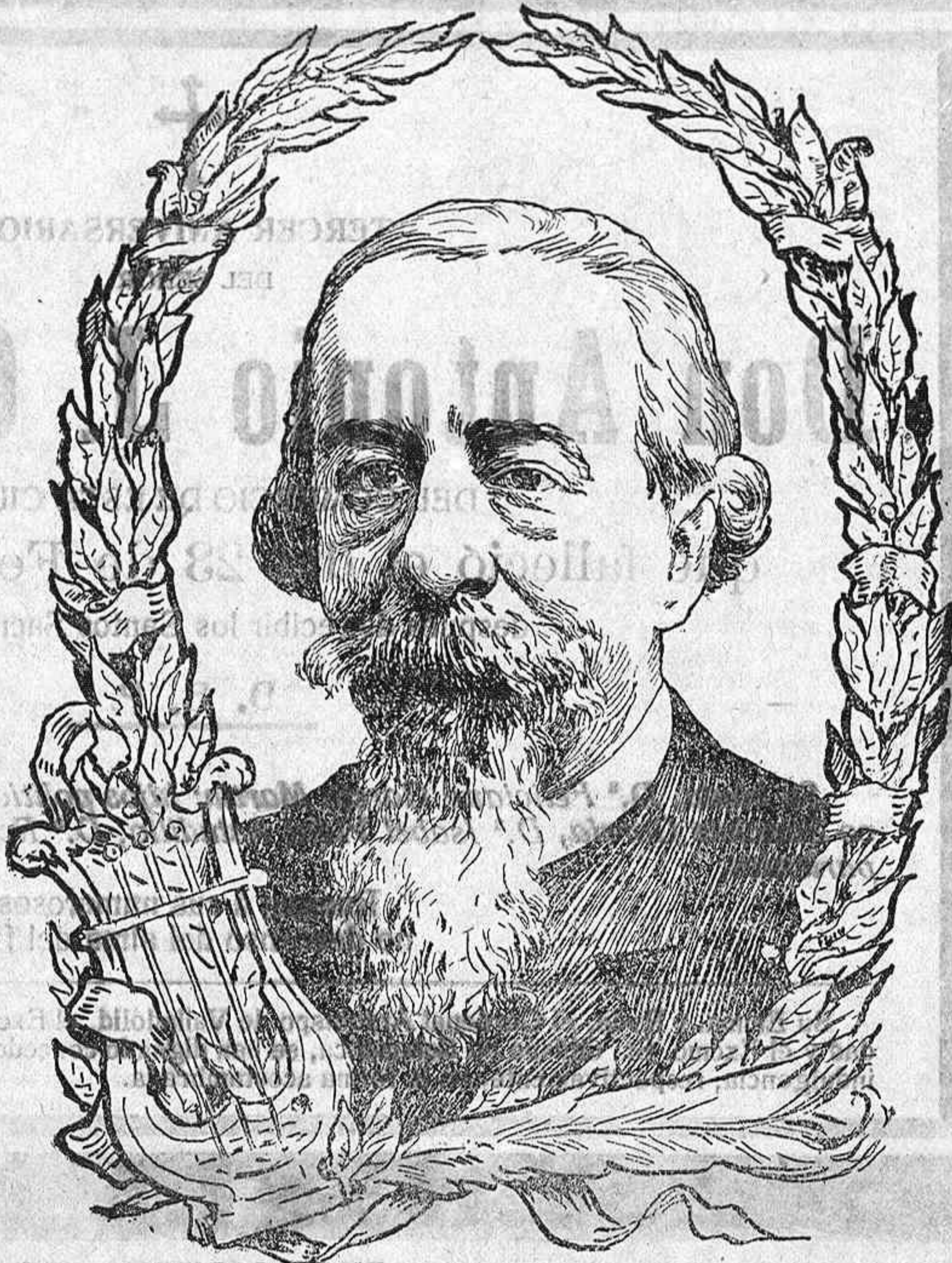
D. José Zorrilla.

viejo narra de modo admirable los más salientes episodios de su vida. De estas preciosas memorias del insigne poeta, lo más curioso quizá es lo que se refiere a D. Juan Tenorio. Esta obra extraordinaria, cuya popularidad no tiene par en la historia de la dramática española, fue escrita por Zorrilla en veinte días. El éxito que obtuvo no hacía prever la inmensa boga que estaba llamada a alcanzar hasta convertirse en re-