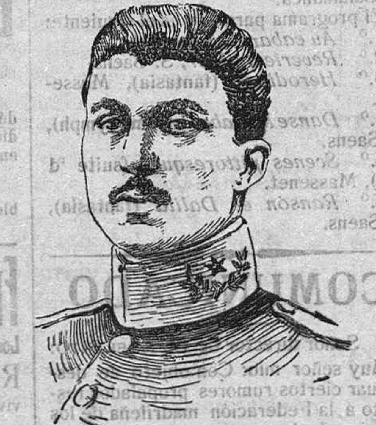
El capitán de Estado Mayor don Alfonso Bayo, piloto aviador de la escuadrilla de aeroplanos que opera en Tetán.