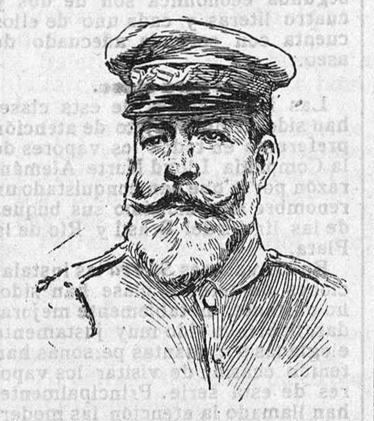
General Marina, nuevo alto comisario de España en Marruecos.

no pocos de los que saben muy bien lo que pasa entre los bastidores políticos, presentan á la simpática figura de aquél, como una víctima de la política imperante. Ojalá estén equivocados los que tal cosa afirman, aunque á hechos de tal naturaleza y á otros muchos más graves y dañinos para los intereses patrios, nos tienen acostumbrados.