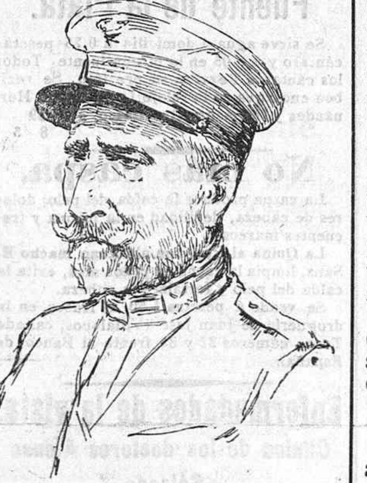
General Alfau, del cargo de alto comisario de España en Marruecos. Los amigos del general Alfau, y

No por muy anunciado y no me nos esperado, ha dejado de producir honda sensación el relevo, esta es la palabra, aunque sea doloroso decirlo, del general Alfau, del cargo de alto comisario de España en Marruecos. Los amigos del general Alfau, y