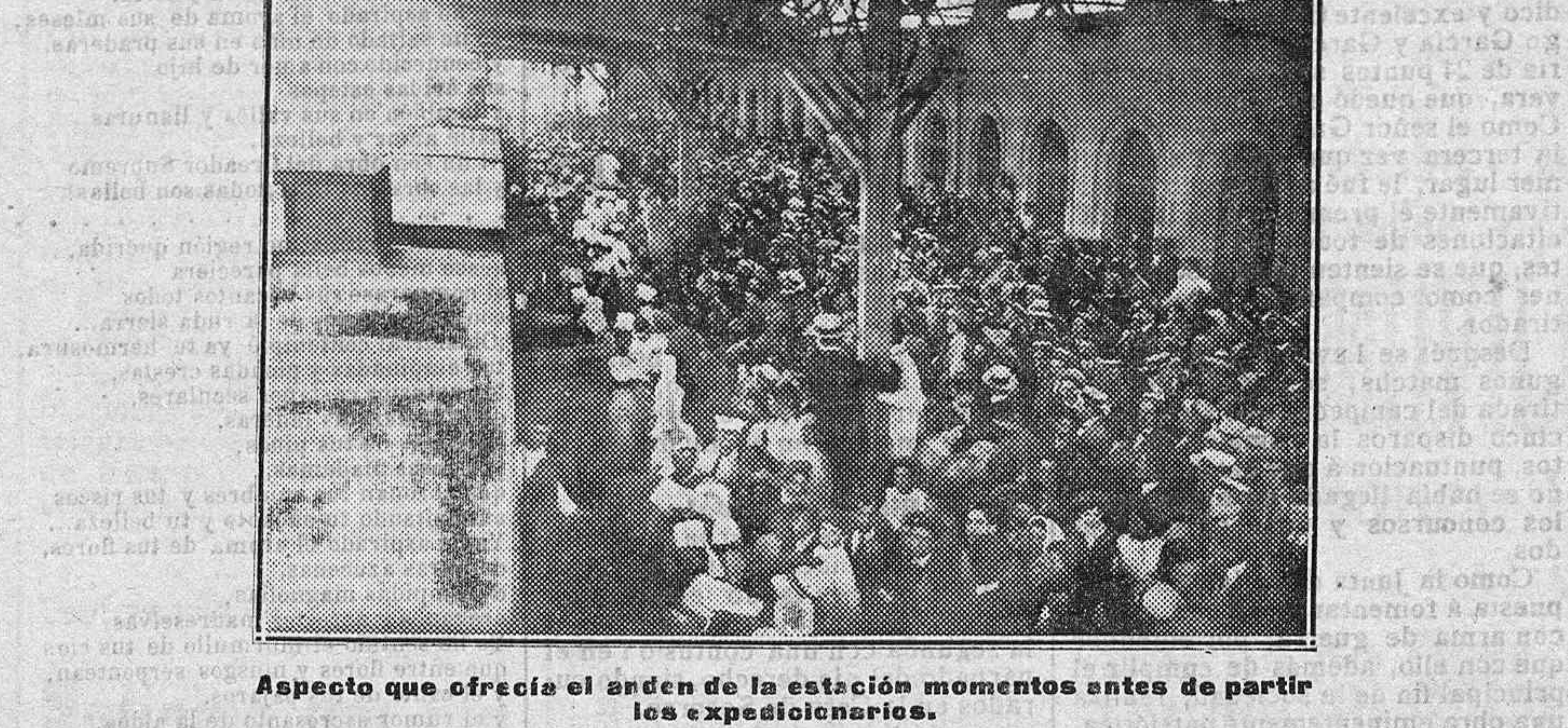
Aspecto que ofrecía el anden de la estación momentos antes de partir los expedicionarios.