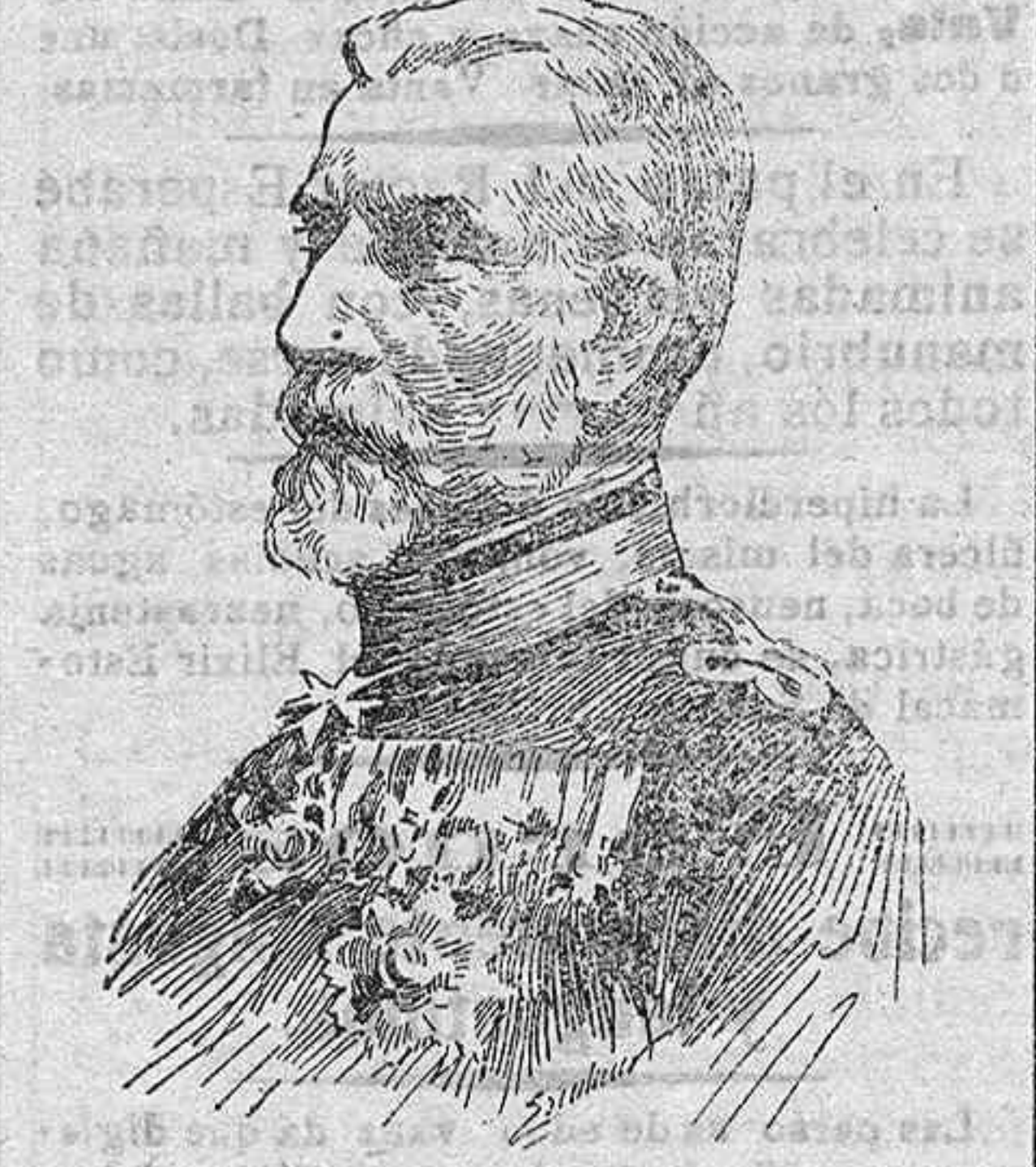
un documento dirigido al de Bulgaria.

El ejército rumano ha pasado el Danubio é invadido el territorio búlgaro, previa la ruptura diplomática y la declaración de guerra. La conducta de Rumanía razonala el Gabinete de Binaresit en