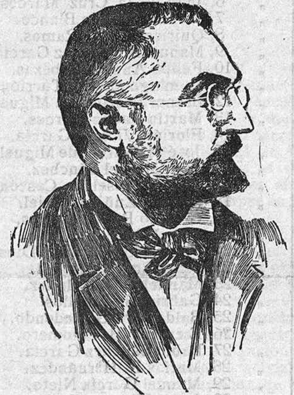
DON MIGUEL DE UNAMUNO. Ilustre rector de nuestra Universidad.

Creo, además, en la acción íntima de la disciplina que llaman ordenancista; creo que el obligarle á uno á cumplir su deber de cada día, conduce á despertarle el sentimiento de más alto deber; creo que la ley hace el espíritu.