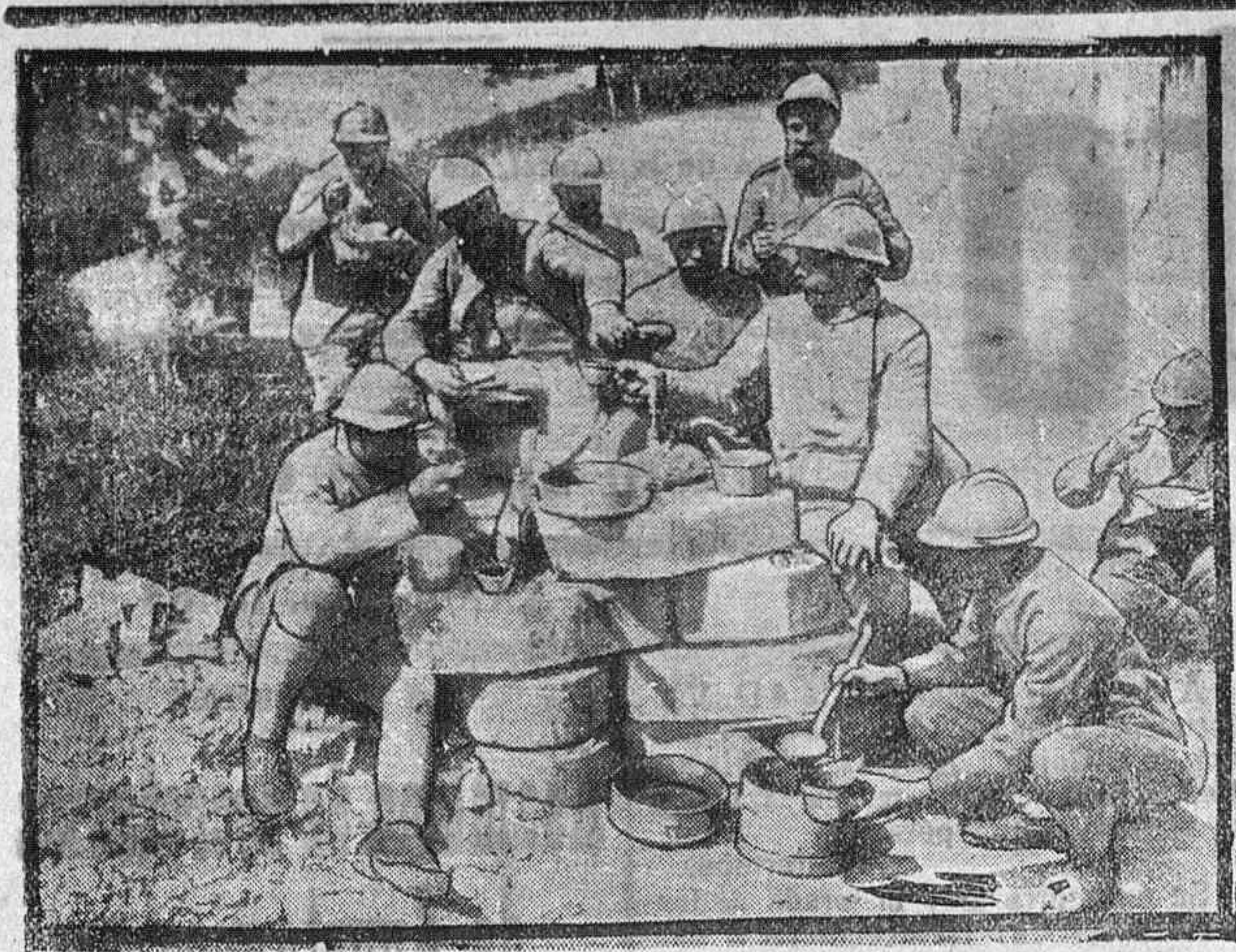
Notas gráficas de la guerra.—Almuerzo en el campamento.

niño se supone que ascenderá a 1,50 ó 1,75 pesetas.