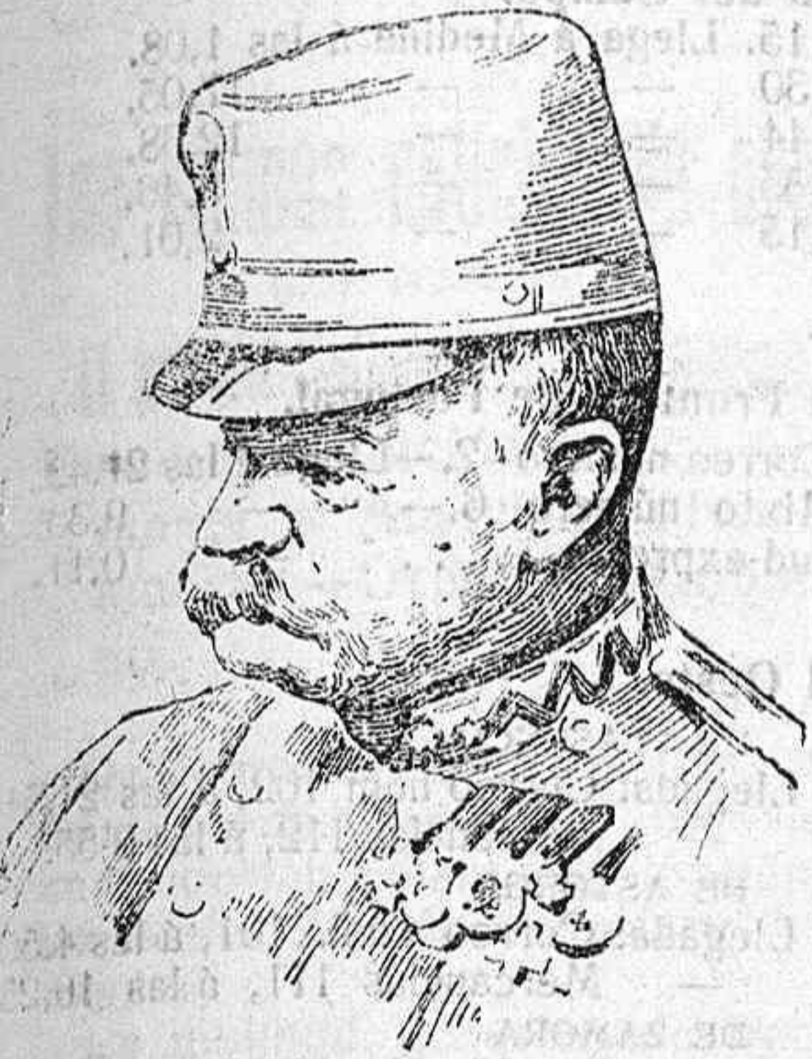
El archiduque Federico de Austria, gene- ralísimo de los ejércitos austro-húngaros.