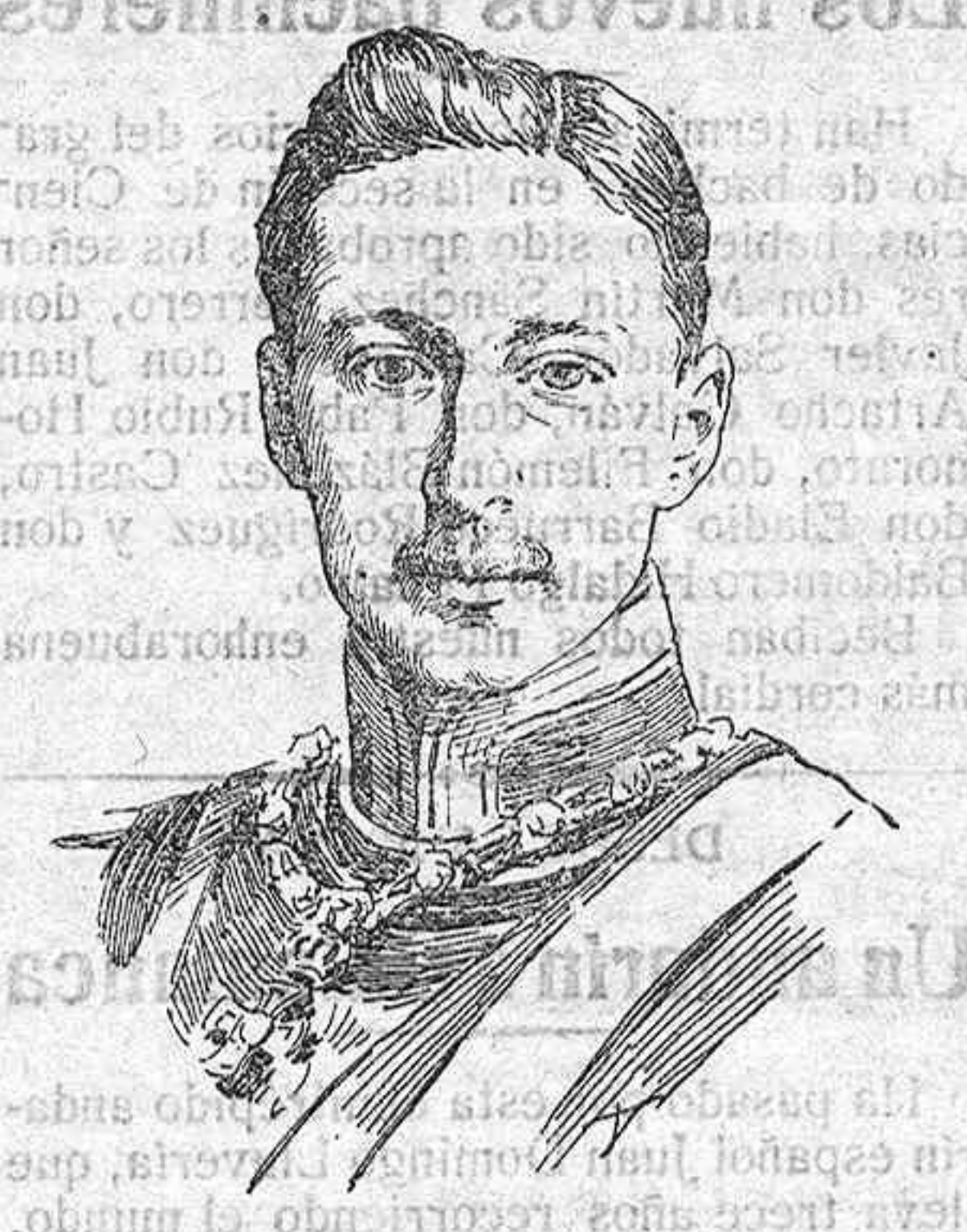
El kromprinz de Alemania.

tado de Prusia, el príncipe Ernesto Augusto de Cumberland, casado recientemente con una de las hijas de Guillermo II, no necesita hacer nuevas y públicas manifestaciones de renuncia á sus derechos al trono de Hannover, porque al prestar juramento de fidelidad á la bandera, le dirigió una carta en la que prometía no atacar nunca contra la constitución prusiana, y como en el artículo 6.º de esta se declara que Hannover forma parte del reino de Prusia, no ha lugar á dudas respecto al asunto, por estar bien clara su renuncia á lo que por herencia pudiera corresponderle.