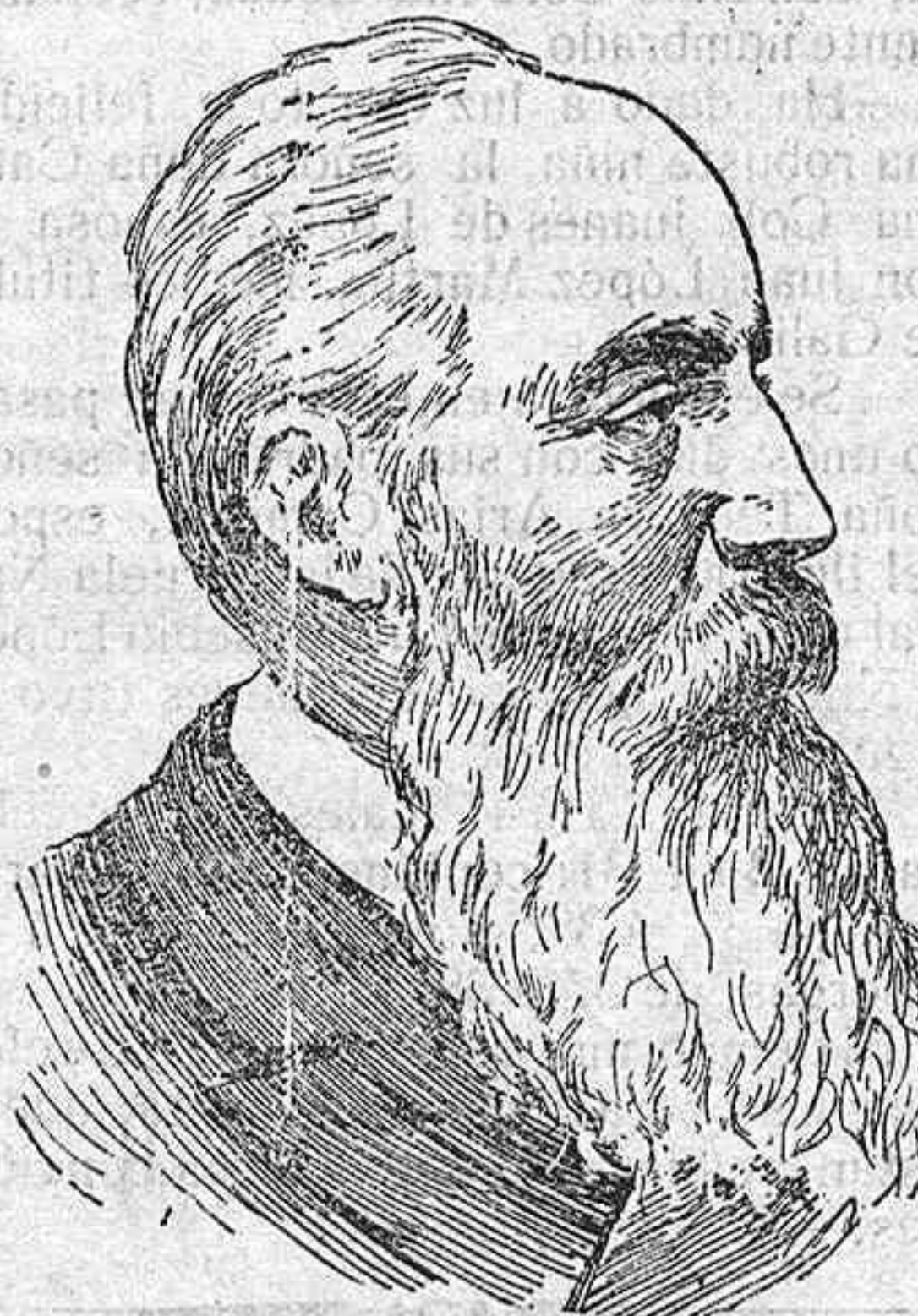
D. ALEJANDRO PIDAL Y MON, ilustre político y director de la Real Academia Española, fallecido recientemente en Madrid.