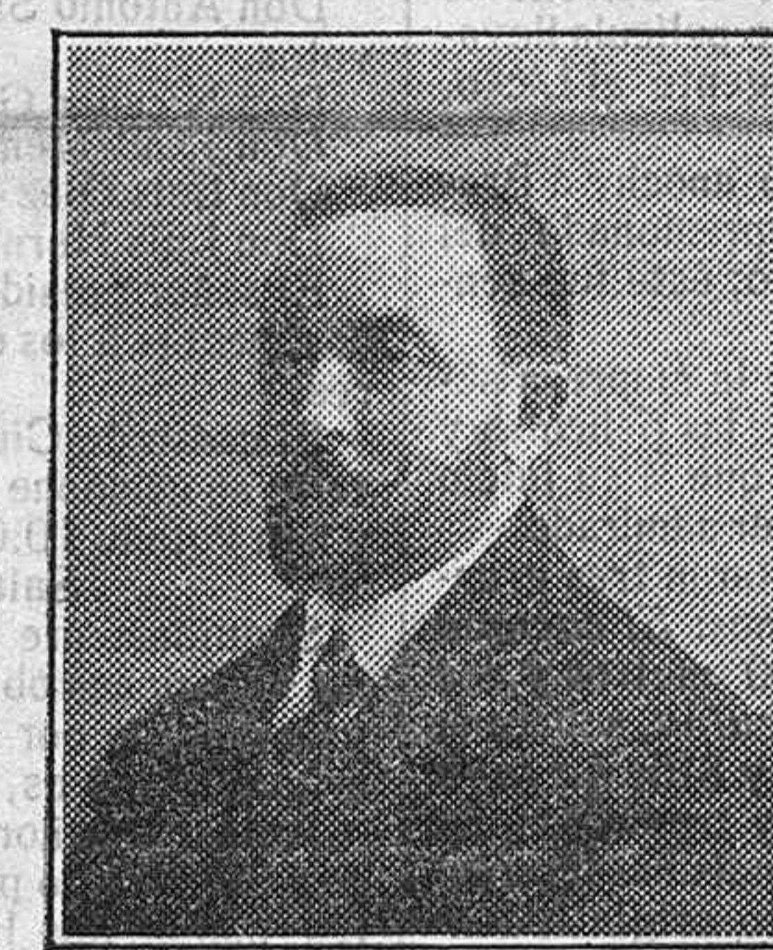
Don Nicanor Gallo, diputado provincial por Ciudad Rodrigo.