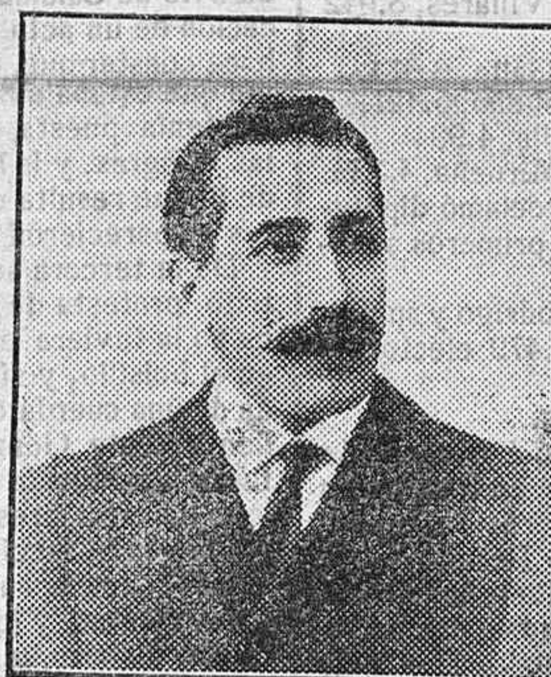
Don Nicolás del Teso, diputado provincial por Salamanca.