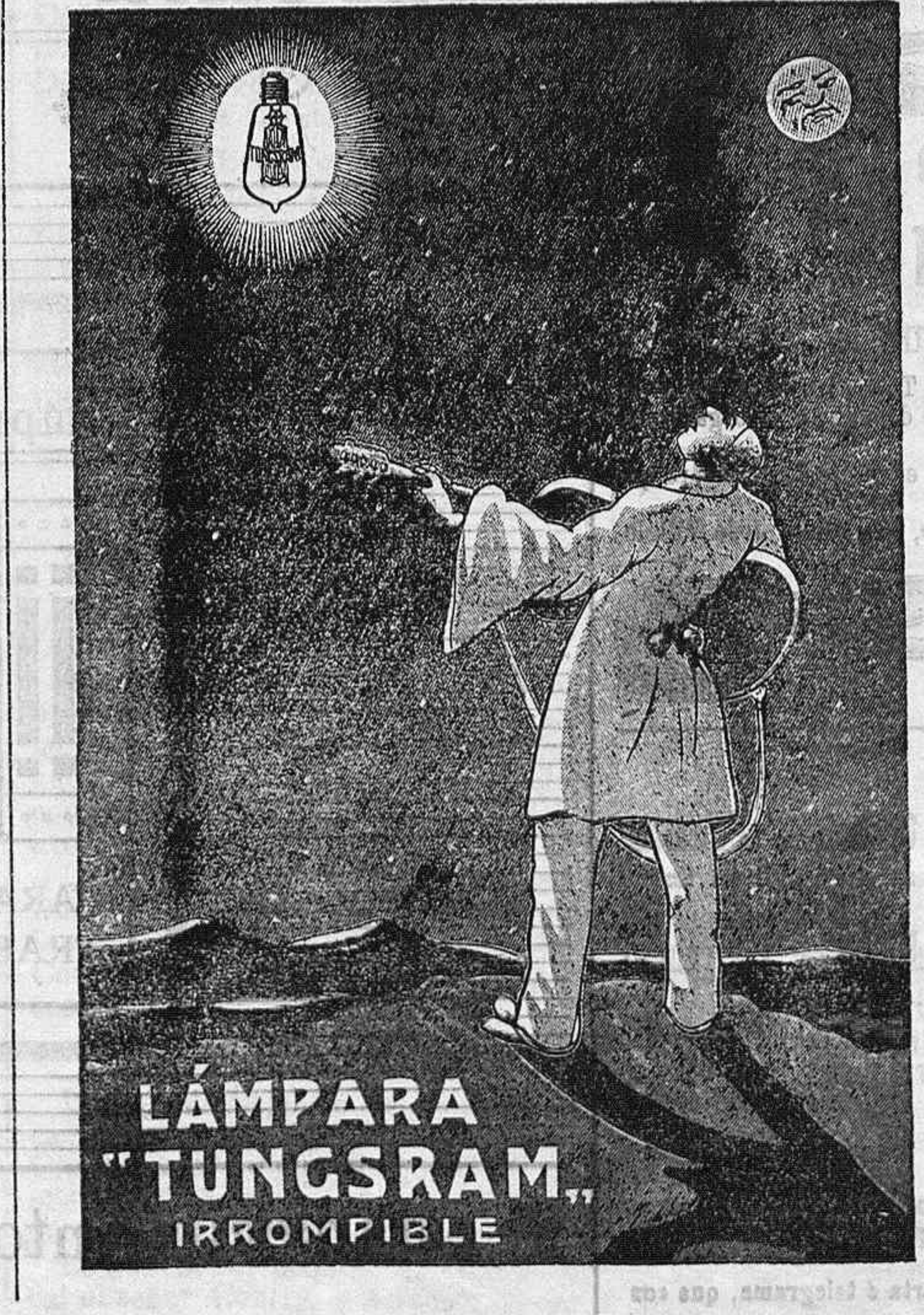
LÁMPARA "TUNGSRAM" IRROMPIBLE

CAPITAL Pesetas 6.000.000. CUENTAS CORRIENTES: Se abren á la vista, á tres y seis meses y á un año, abonándose íntegramente á las mismas. CAJA DE AHORROS: Se admiten imposiciones desde UNA peseta, abonándose á fin de cada semestre el interés de 3 por 100 anual. Cambio de oro y billetes; giros, cartas de crédito, órdenes telegráficas, compra y venta de valores, descuentos, créditos, custodia de valores y alquiler de Cajas de seguridad para particulares. Oficinas en Salamanca: Doctor Riesco, 41. 1 y 2