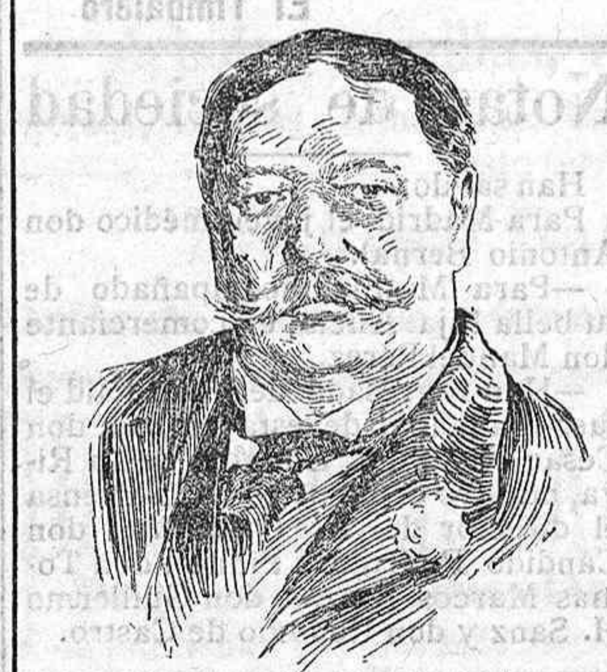
Mister Taft. con motivo de su viaje á Filipinas y el Japón, ha demostrado que es un político de altura, prudente, culto, energético... y más serio que su antecesor, acaso por ser menos yanqui que él. Pero... le dejarán sus amigos conducirse en todas las ocasiones según hacen esperar sus excelentes cualidades?

un buen sentido, más sólido y de un carácter tan justo y noble... como su sucesor. Efectivamente, mister Taft, desde su puesto de ministro de la Guerra y