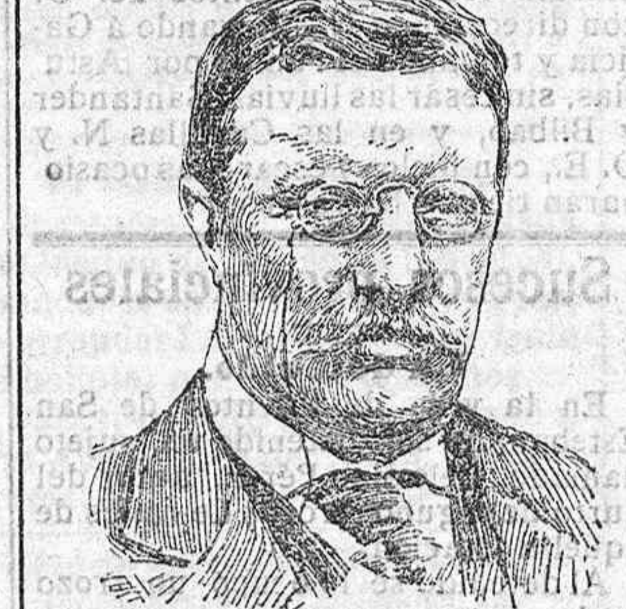
Mister Roosevelt. por tanto, para los Estados Unidos de la América del Norte, un nuevo período de su historia.

En el hermoso salón de las grandes solemnidades del Capitolio de Washington, y ante las dos Cámaras de representantes y senadores, mister Teodoro Roosevelt acaba de hacer entrega de sus poderes de presidente de la República, á su sucesor y amigo mister Taft; ha comenzado,