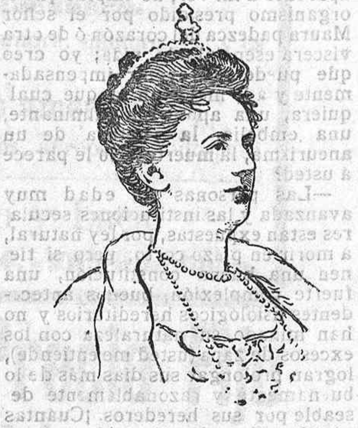
Último retrato de la Reina Guillermina.

La Prensa de los dos países se apoderó de esta noticia y la comentó según le convenía. Tratábase de reunir las coronas de Bélgica y de Holanda. ¡Im-