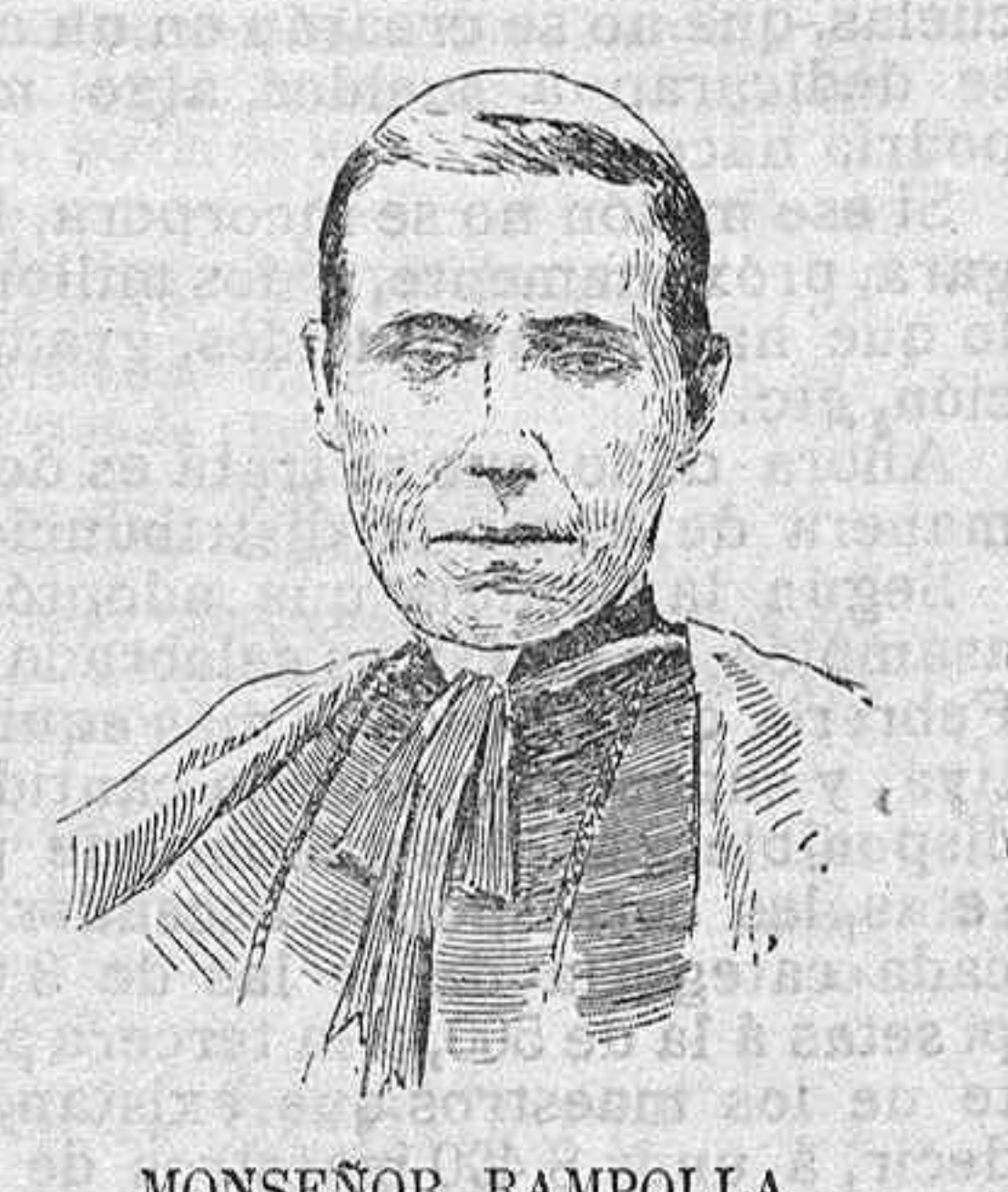
MONSEÑOR RAMPOLLA nombrado sucesor del cardenal Capecepatro en el cargo de bibliotecario del Vaticano.

tad de Medicina, en la que se han educado tantos muchachos, que si no llegan todos ellos á la altura de Fernando Fornos, porque sería imposible, son por lo menos de valía, y dignos de que nos acordemos de ellos. Una prueba más de que la labor que se realiza en esta Universidad es honrada y seria y de que esta Escuela, tan respetable por sus tradiciones, puede aún esperarse mucho en el presente.