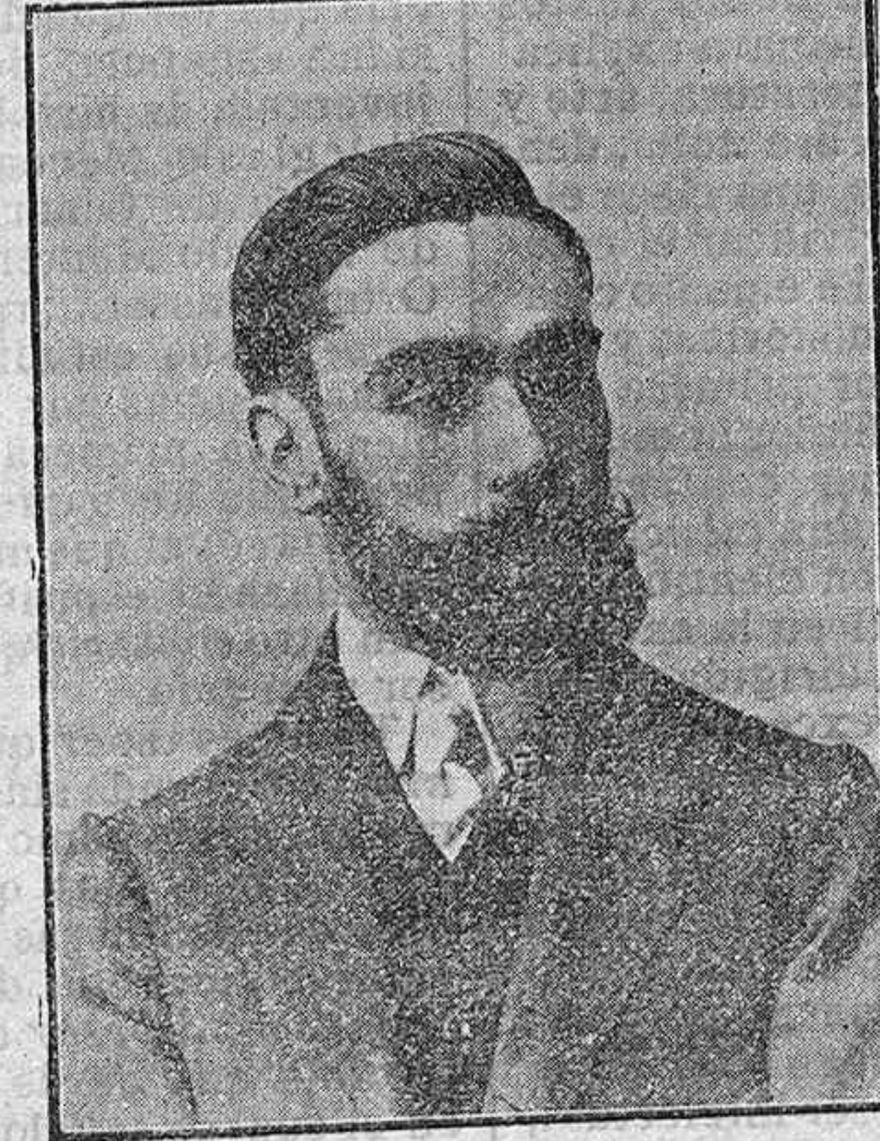
DON FEDERICO DE OÑIS, catedrático de la Universidad de Oviedo.

Recordando largas horas tediosas y estériles, pasadas día tras día, durante diez años, en tristes cátedras, de las que no quiero acordarme, porque no quiero imputar á unos cuantos hombres culpas que tienen su origen en males colectivos más hondos, de los que ellos eran víctimas