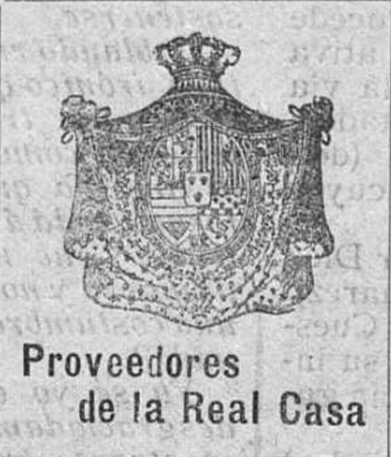
Proveedores de la Real Casa

De este gusto puede aprovecharse todo el mundo, puesto que tenemos aparatos al alcance de todas las bolsas.