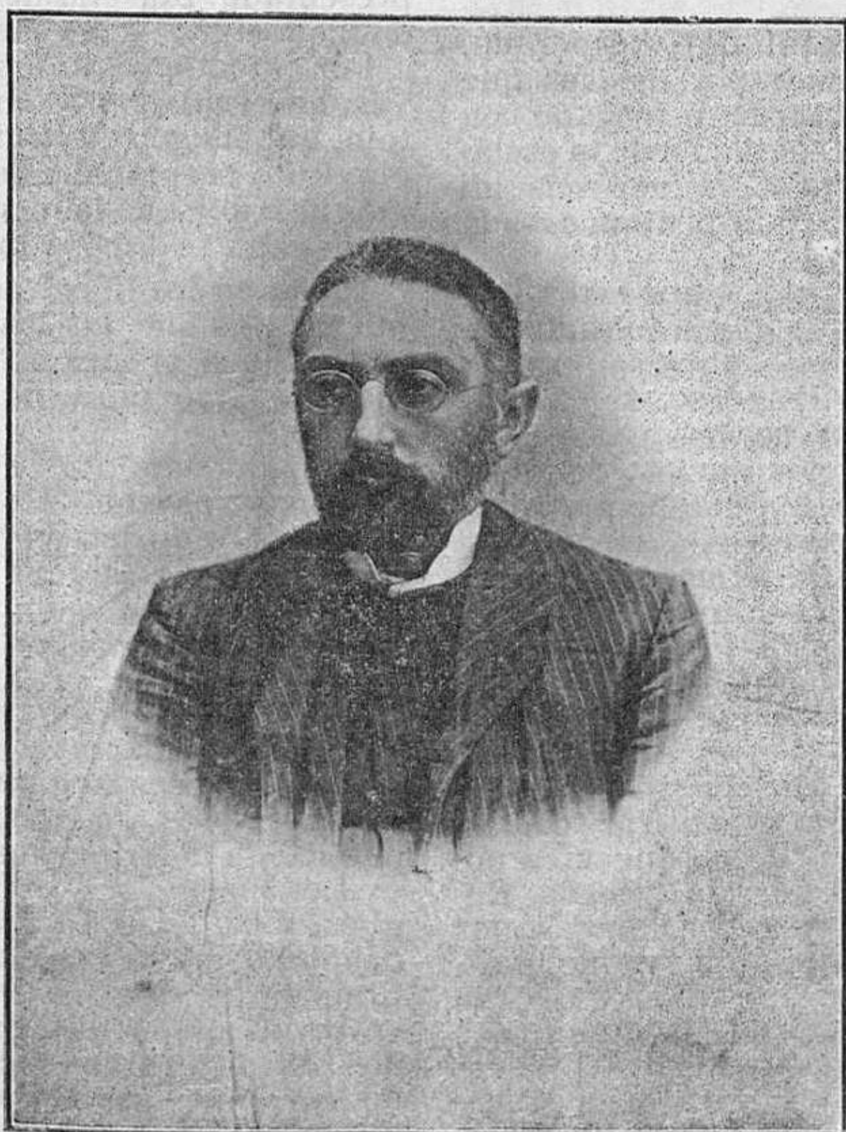
D. MIGUEL DE UNAMUNO. Presidente del Jurado.

¡Qué dulce y majestuosa cae la tarde! ¡Páreceme que corre por mis venas! Su calma tibia y su dulzura augusta con la del cielo limpia transparencia, están dentro de mí y en mí las siento fundidas con mi sangre que serenan. El inquieto pensar se ha vuelto tardo: Dijérase que envuelto en una niebla