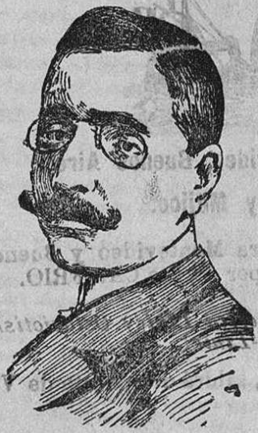
Señor Pérez Caballero Nuevo ministro de Estado