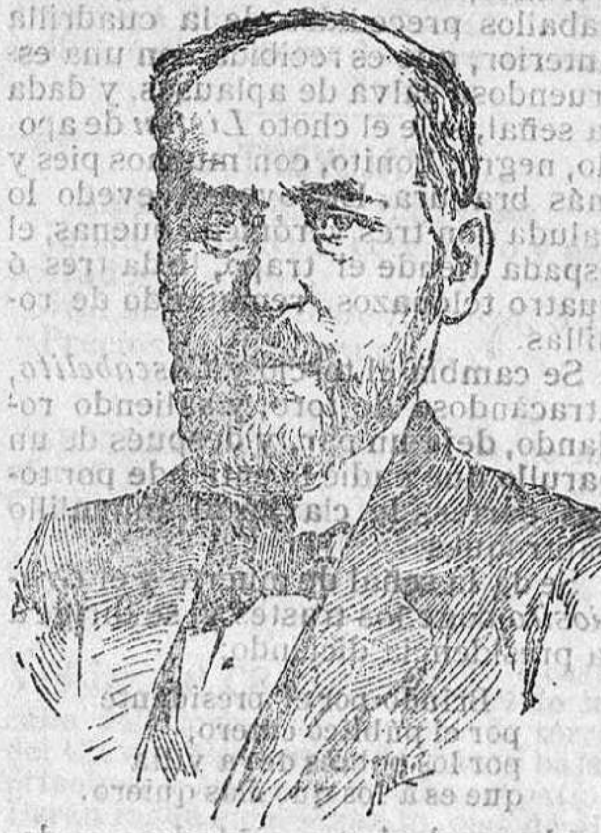
Don Santiago Ramón y Cajal.