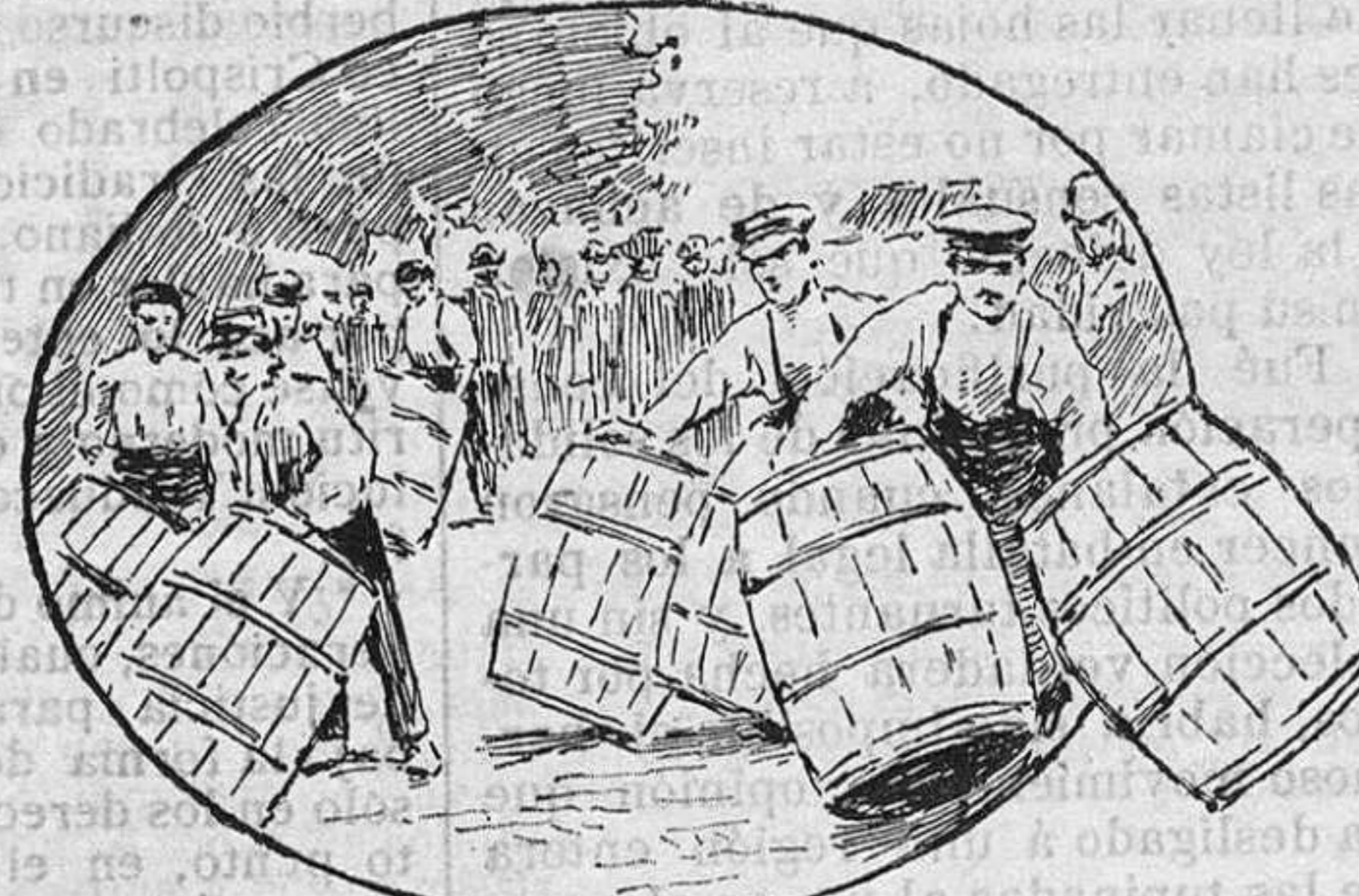
El concurso de rodadores de toneles.

El Diario Oficial del ministerio de la Guerra ha publicado una disposición ordenando que á los que posean la laureada cruz de San Fer-