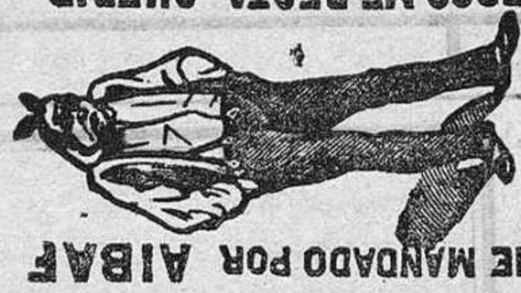
HE MANDADO POR AIBAF