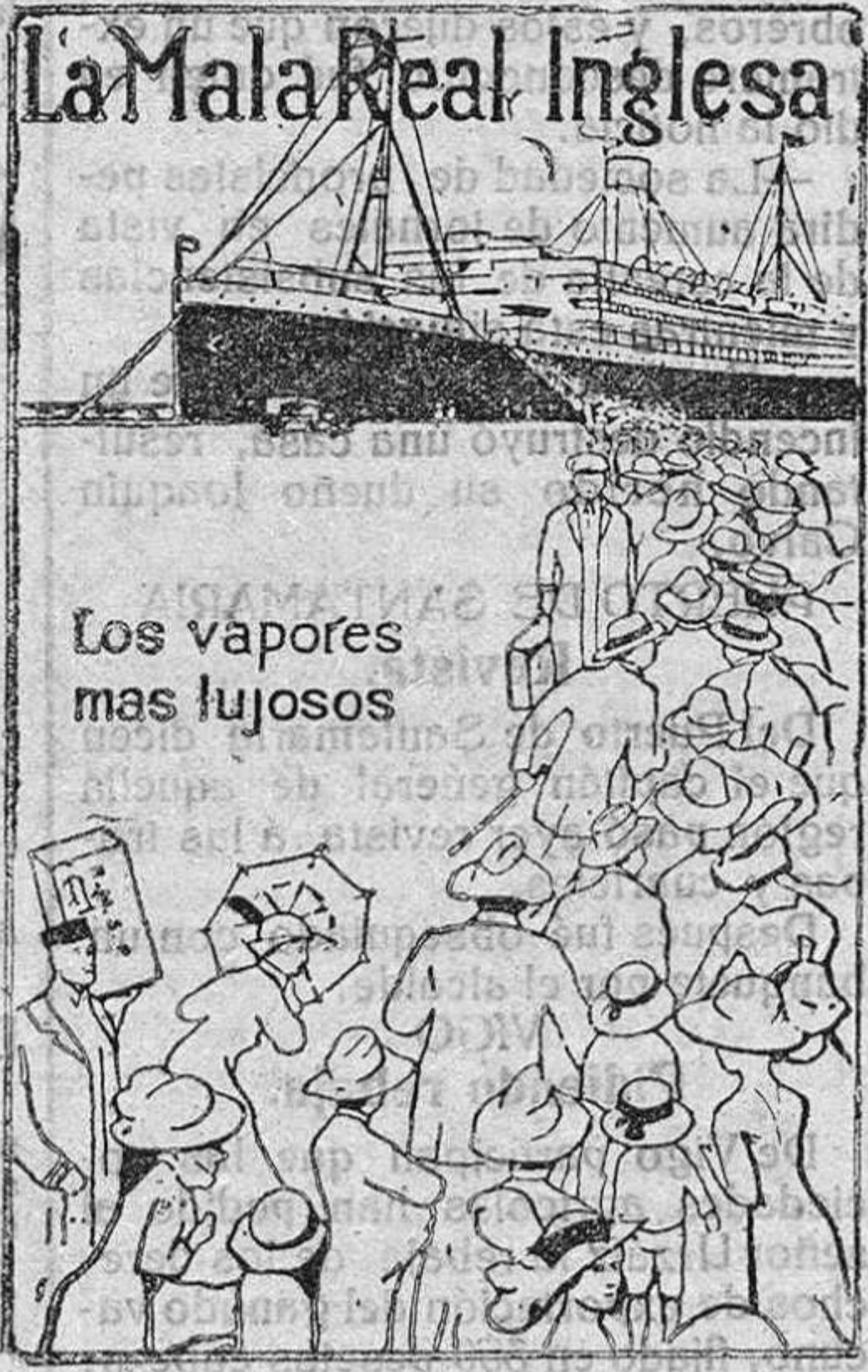
Los vapores mas lujosos

R. M. S. P. SERVICIO RAPIDO PARA PERNAMBUCO BAHIA RIO JANEIRO SANTOS MONTEVIDEO Y BUENOS AIRES