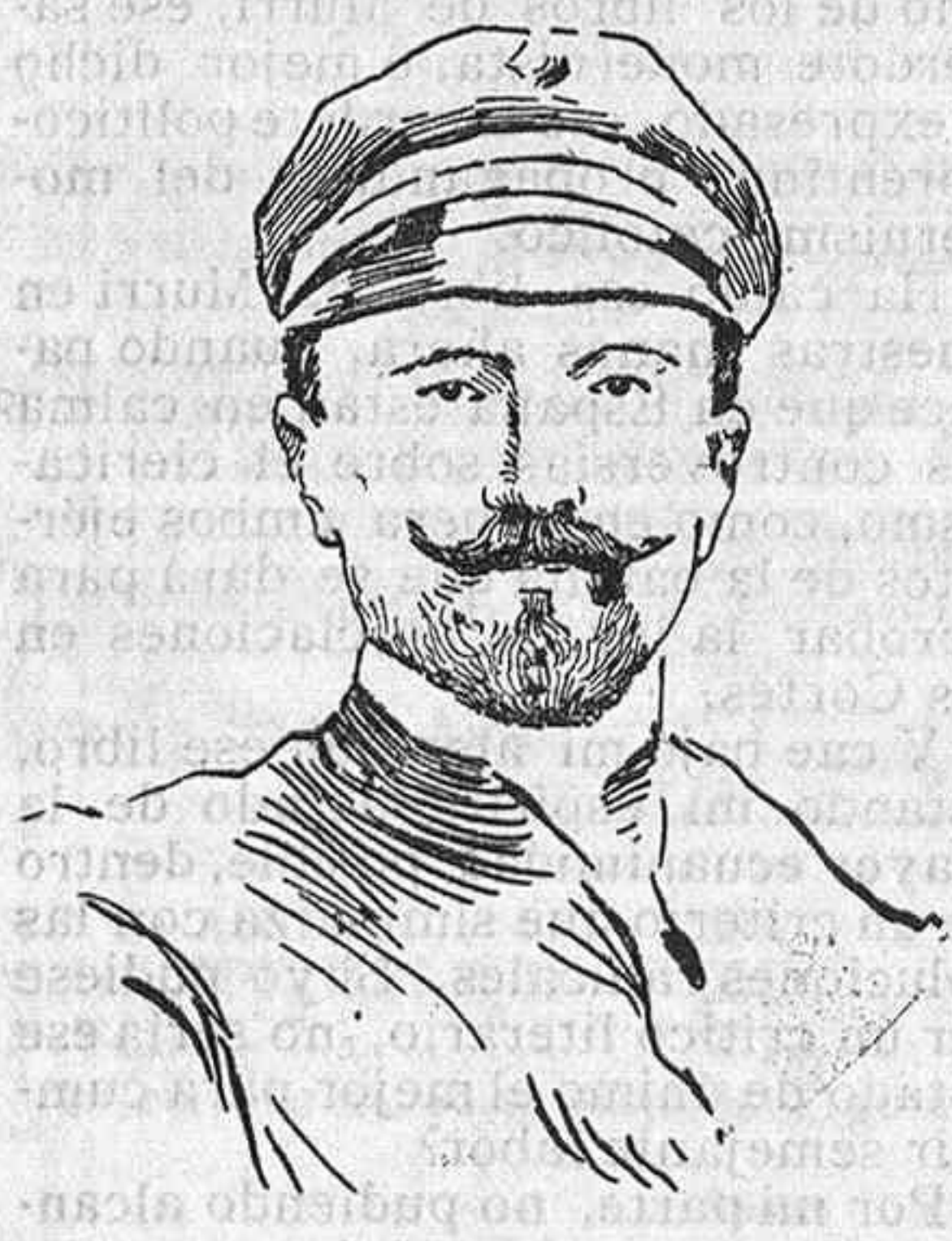
Beaumont, vencedor en el "raid, aéreo Paris-Roma-Turín.

Reciban todos nuestra sincera enhorabuena.