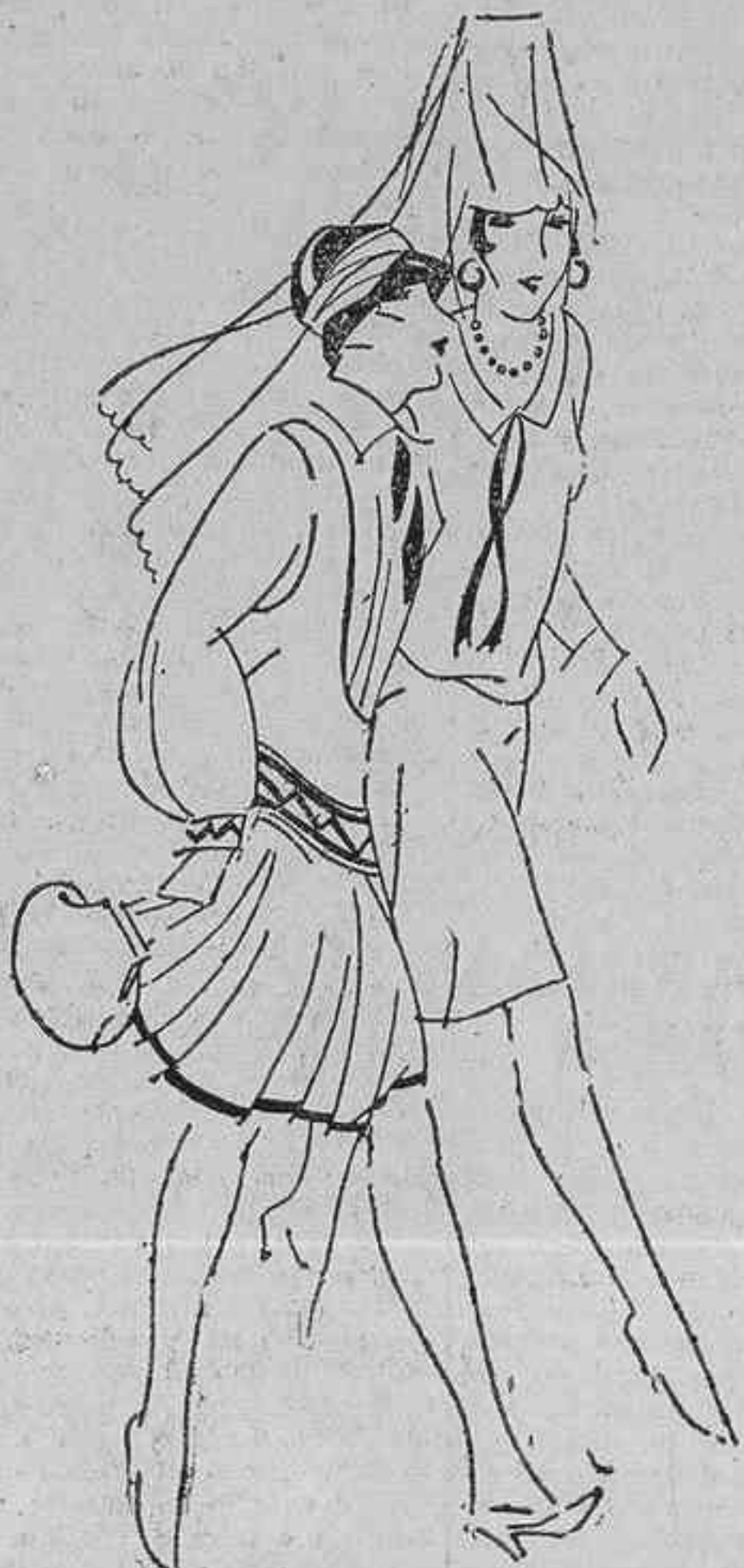
RECORRIENDO LAS ESTACIONES

Londres, 14.—El corresponsal del «Morning Post» en Pekín telegrafía: «Los comunistas envían ahora amenazas anónimas a los corresponsales de los periódicos británicos. Yo mismo acabo de recibir una que dice así: «Es usted un agente nortista como enemigo del pueblo chi o debe tener cuidado, porque nuestra venganza le alcanzará como a todos los demás británicos, y esto sucederá, necesariamente, muy pronto.»