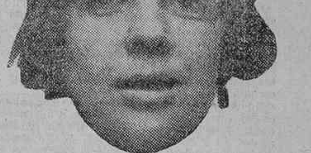
Nuestra insigne actriz Catalina Bárcena, que realiza una magnífica campaña de arte en América

Acaba de morir en Nueva York el actor americano James Hackett, conocido en Madrid por haber intervenido en su época de empresario en un negocio teatral en combinación con los