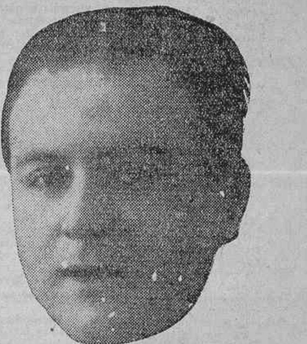
El popular maestro compositor Jacinto Guerrero, que en breve marchará a la Argentina, donde se propone permanecer unos meses

Acaba de morir en Nueva York el actor americano James Hackett, conocido en Madrid por haber intervenido en su época de empresario en un negocio teatral en combinación con los