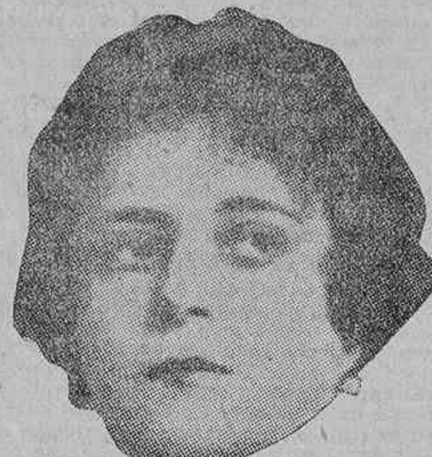
La ilustre actriz argentina Camila Quiroga, muy aplaudida por nuestro público, ante el que actuará de nuevo muy pronto