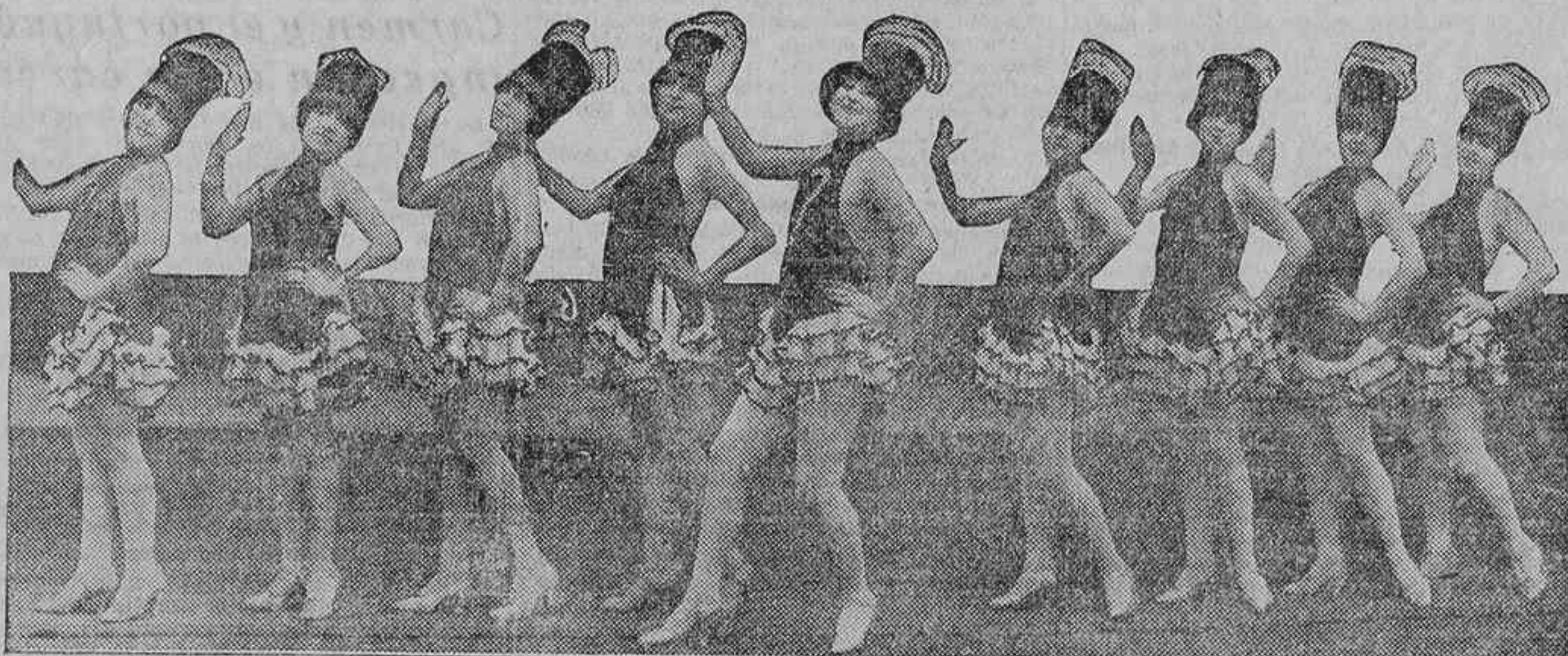
ALGUNAS DE LAS BELLAS ARTISTAS QUE ACTUAN EN LA PELICULA ESPAÑOLA «FRIVOLINAS»

Recordamos a nuestros clientes cinematografistas que LA LIBERTAD, aparte de su gran difusión general en el país, llega a manos de todos los elementos de España interesados en el negocio cinematográfico.