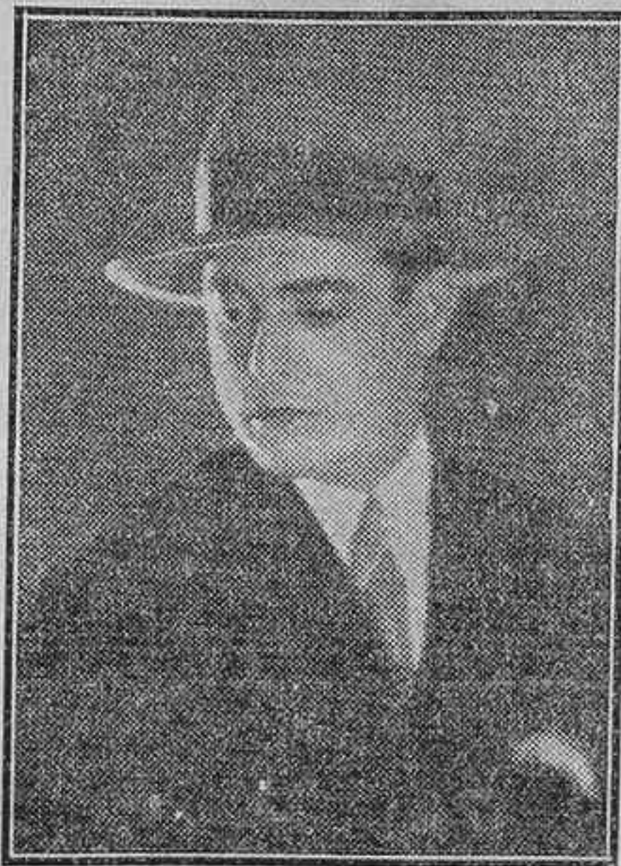
El notable galán joven Felipe Fernández, uno de nuestros artistas cinematográficos de más valía y de acusada personalidad