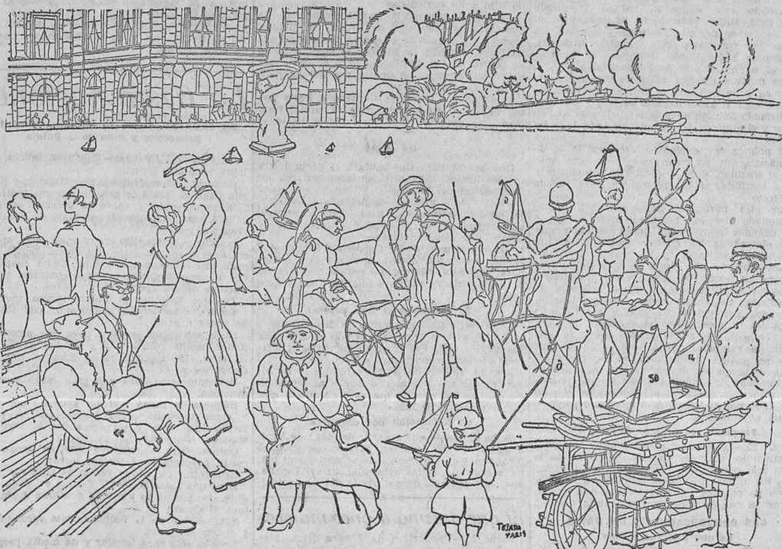
EL JARDIN DE LUXEMBURGO