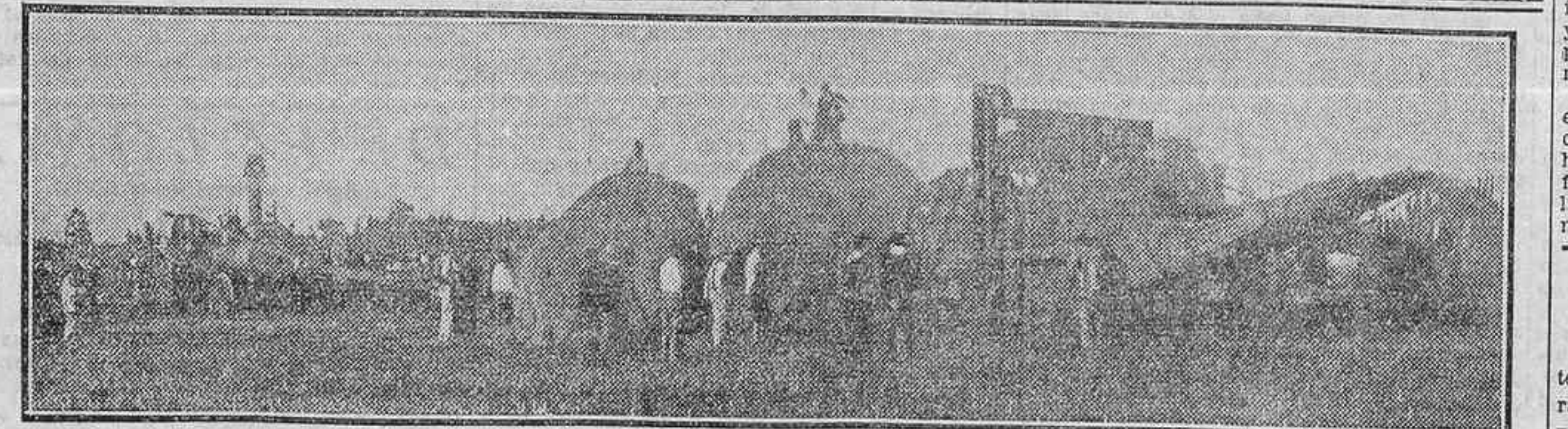
DEL «VERANO», TREN DE TRILLA EN PLENA LABOR

Fertilización del maíz El empleo de 300 kilogramos de Nitrato de Chile por hectárea aumenta la producción en 1,175 kilogramos, como promedio determinado en numerosas experiencias.