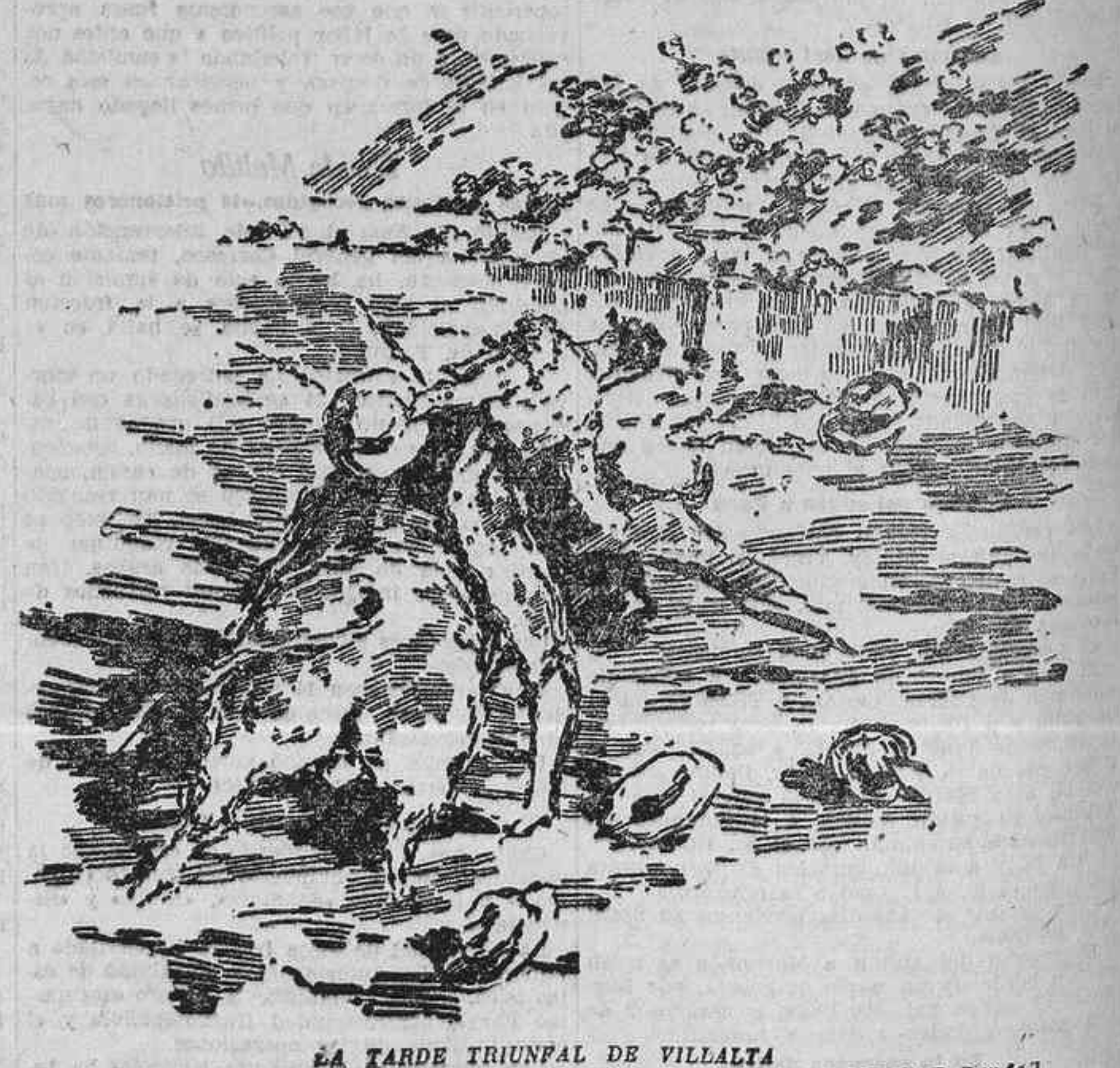
LA TARDE TRIUNFAL DE VILLALTA (Apuntes del natural por Martínez Bando)