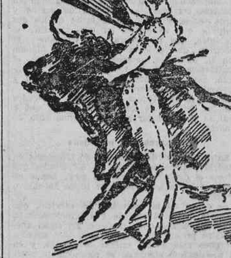
VILLALTA EN EL PASE DE COSTADO