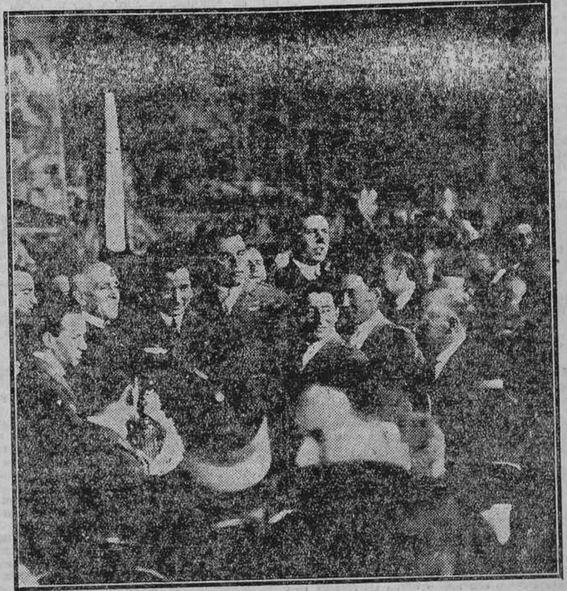
EL REGRESO DE LOS TRIPULANTES DEL «PLUS ULTRA».—EL ALMIRANTE PORTUGUES GAGO COUTINHO Y LOS AVIADORES ESPAÑOLES EN LA RECEPCION CELEBRADA EN EL CIRCULO DE LA UNION COMERCIAL DE SEVILLA