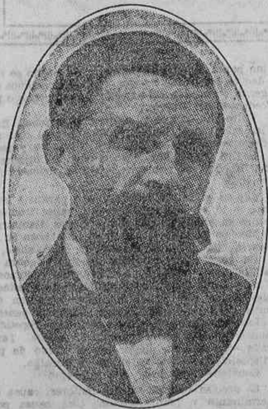
El doctor Decroly

Invitado por el Congreso Internacional de Protección a la Infancia, el doctor Ovidio Decroly ha venido a Madrid con el propósito de desarrollar algunas conferencias pedagógicas.