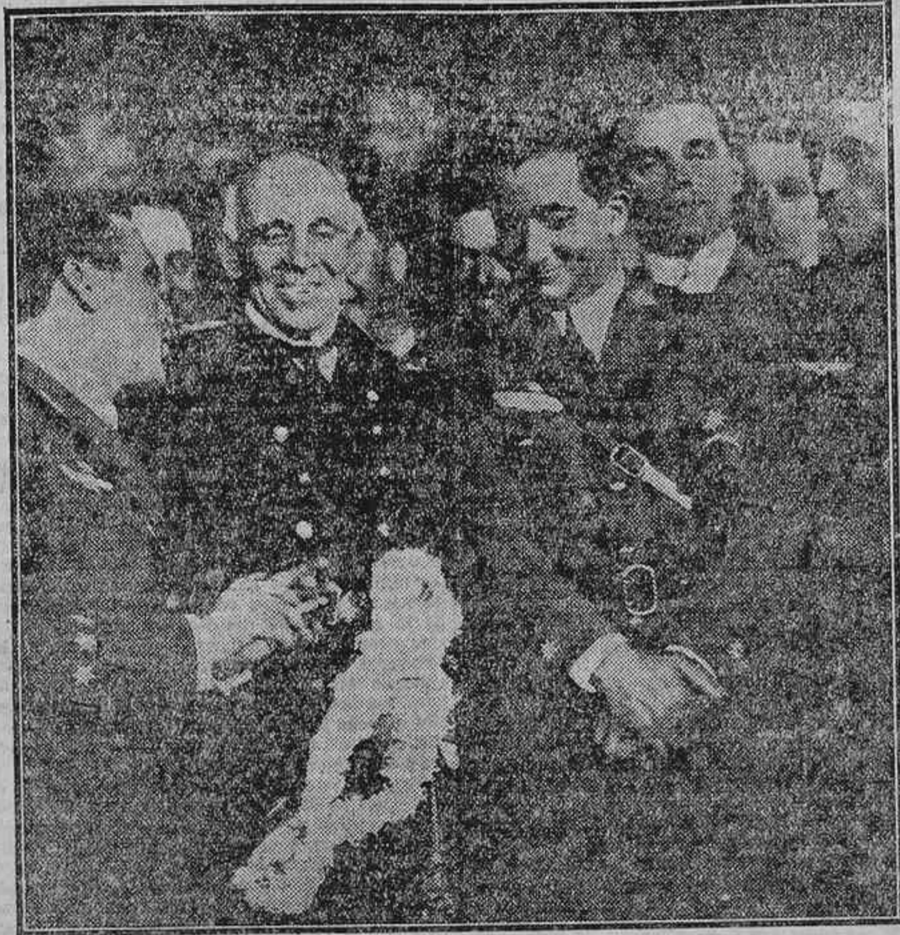
EL REGRESO DE LOS TRIPULANTES DEL «PLUS ULTRA».—EL ALMIRANTE PORTUGUES GAGO COUTINHO, EN SEVILLA, ABRAZANDO A NUESTROS INTREPIDOS AVIADORES FRANCO Y RUIZ DE ALDA