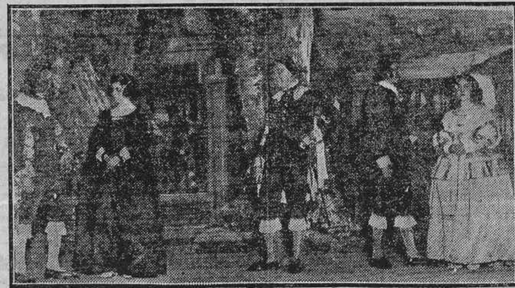
UNA ESCENA DE LA COMEDIA «EL IMPOSIBLE MAYOR», ÚLTIMA PRODUCCIÓN DEL ILUSTRE SAINETERO D. TOMAS LUCENO, ESTRENADA AYER CON MUCHO ÉXITO EN EL TEATRO DE LA PRINCESA POR EL CUADRO ARTÍSTICO DE LA SOCIEDAD LINARES-RIVAS

Las conferencias se darán en lengua española.