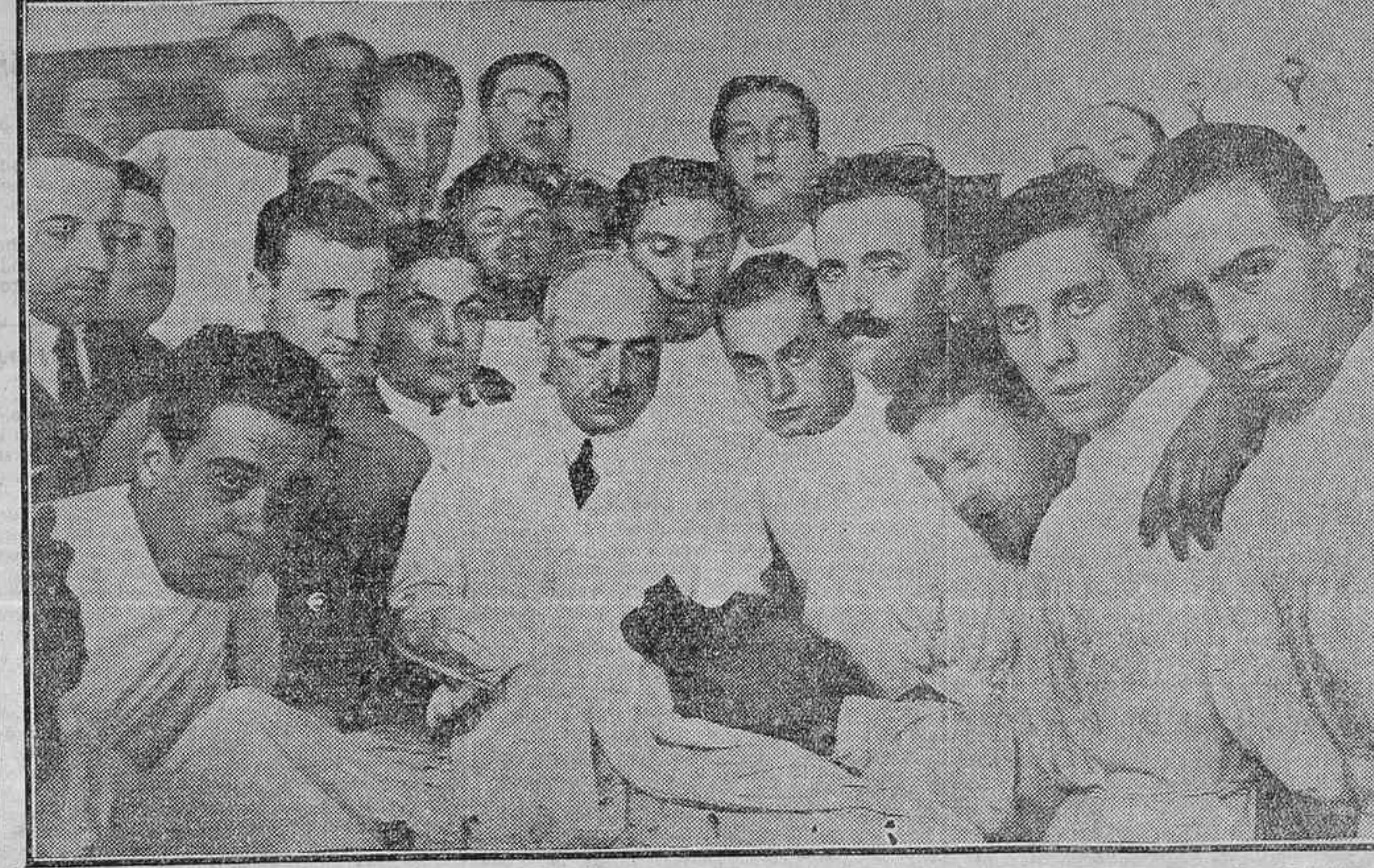
EL MONO QUE EL DOCTOR CARDENAL HA UTILIZADO PARA SUS INERTOS DURANTE LAS OPERACIONES QUE AYER PRACTICO A VARIOS ENFERMOS

El número de adhesiones que se han resibido ya es muy crecido y el homenaje será indudablemente digno de los merecimientos del nuevo catedrático.