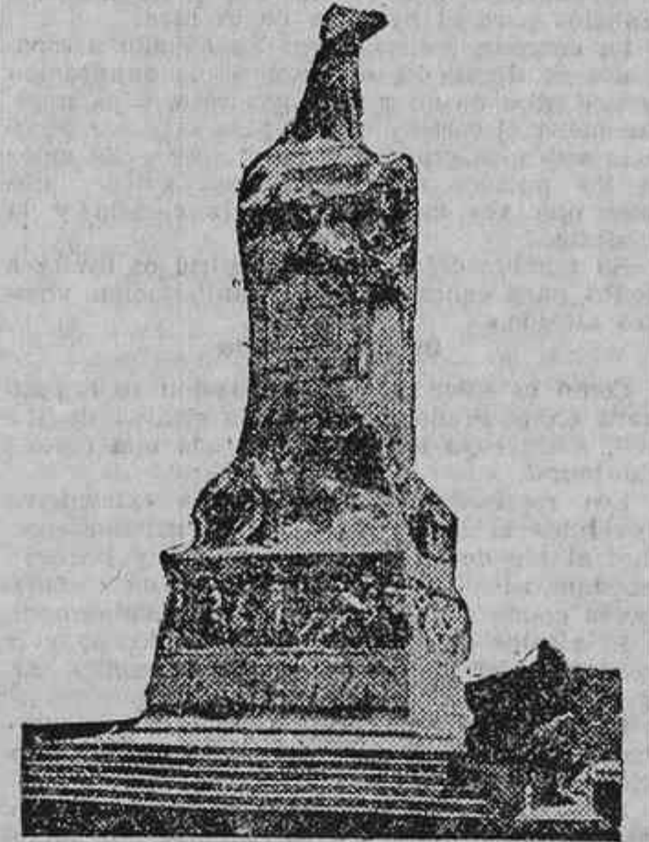
El monumento dedicado por España a la Argentina en la ciudad de Buenos Aires

Seguro de ser fiel transmisor del sentir de España, al emprender su ruta nuestros aviadores, este Gobierno espera del Gobierno argentino que haga llegar a ese gran pueblo la salutación cariñosa de la nación española, orgullosa de ver hoy remozado en la Argentina