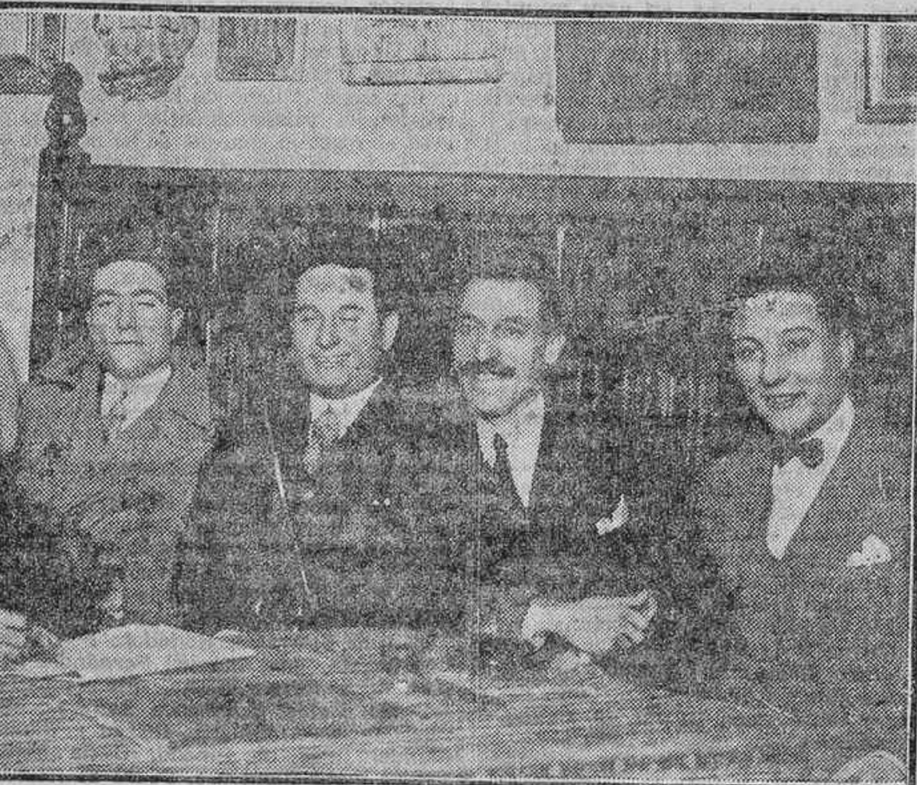
LOS DUEÑOS DE LA TIENDA DE ANTIGÜEDADES DE LA CALLE DEL PRADO, 45, Y SUS DEPENDIENTES, QUE JUGABAN DOS VIGÉSIMOS DEL «GORDO»