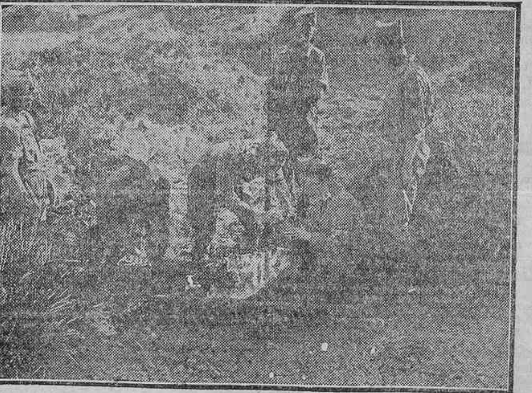
EL DESEMBARCO.—CUBANDO A UN LEGIONARIO EN CEBADILLA