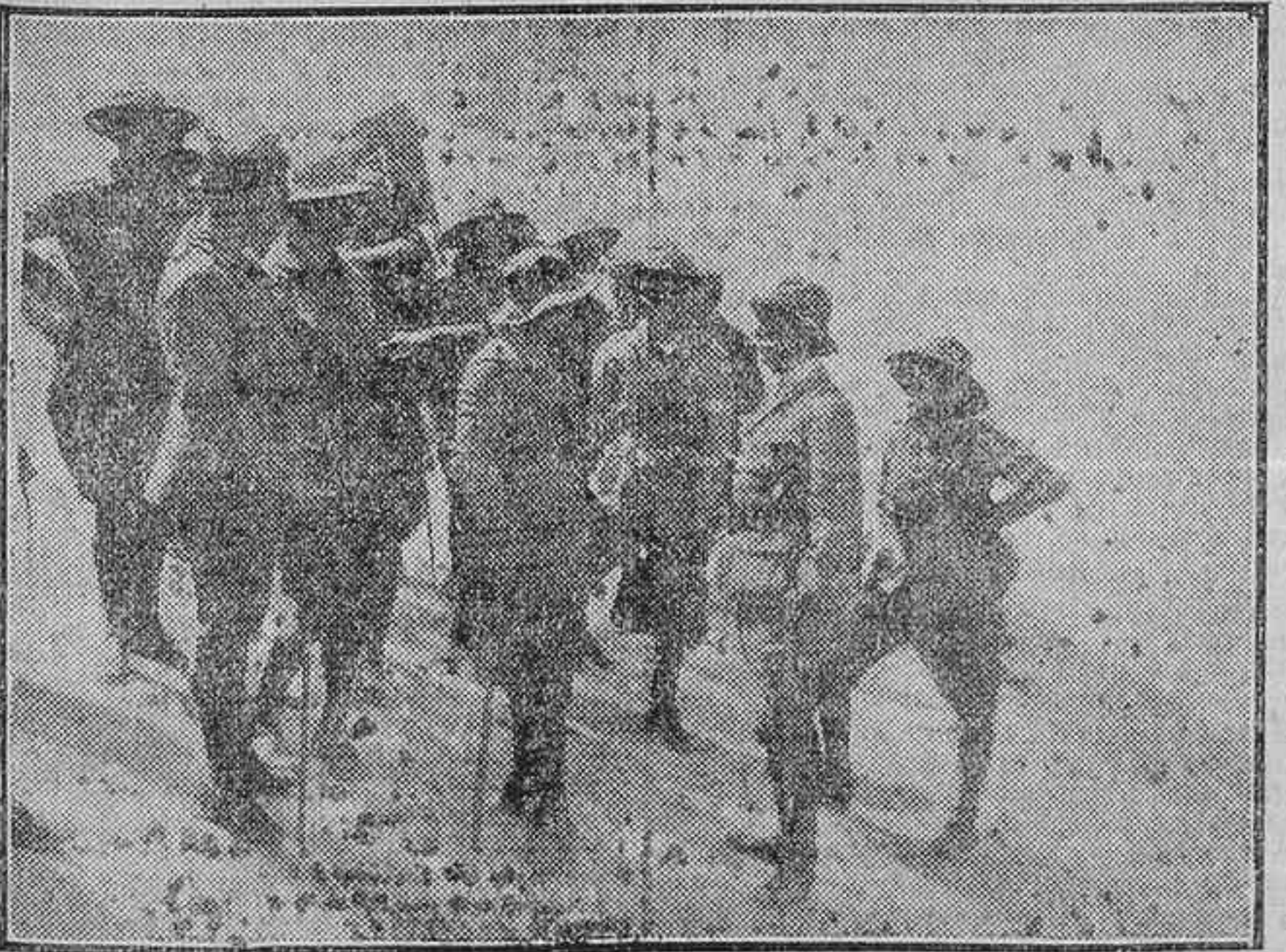
EL DESEMBARCO.—EL GENERAL SARO, CON SU ESTADO MAYOR, EN MORRO NUEVO

La "Hoja Oficial" publicó ayer mañana el siguiente telegrama de Primo de Rivera: "Iniciado al amanecer avance por las columnas, no han encontrado del enemigo más que cadáveres, y, por lo tanto, sin un tiro han llegado a Kudia Tahar, entrándoles el primer convoy de agua y reforzando la guarnición, que será relevada y recibida con honores dentro de unas horas en Tetuán. No podía coincidir para mí la fecha de hoy con suceso más grato, pues del éxito de este combate dependía el alzamiento o quietud de Yehala entera, y el terreno no me aconsejaba enganchar en él más fuerzas en evitación de bajas inútiles; además, mi línea defensiva ha respondido; no flaqueando ante un ataque diez días, con nueve cañones, varias ametralladoras y tres mil rebeldes decididos a todo. Verdad es que la mejor línea ha sido la bravura insu-