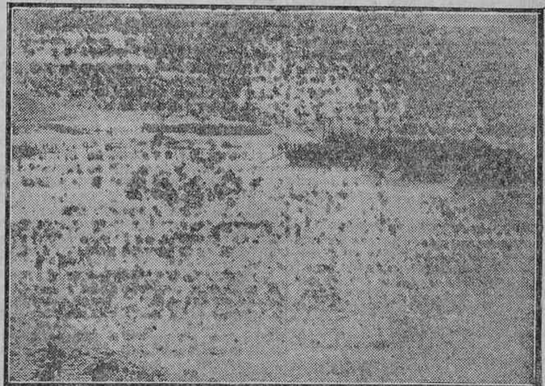
EL DESEMBARCO.—SOLDADOS DE LA COLUMNA DE SARO DIRIGIENDOSE A TIERRA CON EL AGUA A LA CINTURA

de veintisiete correspondientes de guerra, entre españoles y extranjeros. Cuando por la noche regresaba al "Escolano", pues por no haber llevado víveres no quise quedarme en tierra con la Legión, las posiciones ocupadas por nuestras tropas parecían, por sus luces, un pueblecillo de la montaña. La bahía, en la parte que da frente a dichas posiciones, ofrecía también pintoresco aspecto con sus ciento y pico de barcos iluminados y proyectando potentísimos rayos de luz sobre los montes enemigos. El globo cautivo, remolcado por el "Jaime", se balanceaba en lo alto. Nuestra lancha de vapor, agitada por el mar de fondo, nos llevó al vapor donde nos albergamos los periodistas. Contrastando con las luces de los campamen-