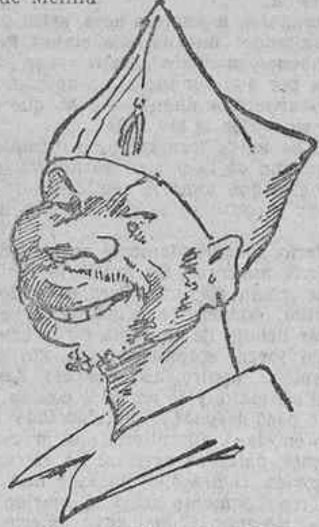
El «coco» de la Legión

«Ha desembarcado en la playa de Cebadilla la mehalia de Melilla».