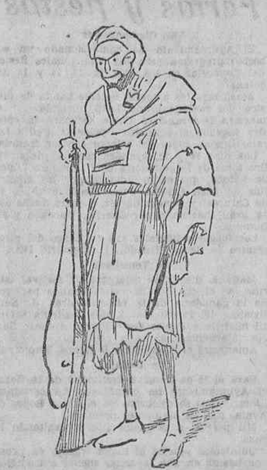
Infante de la jarka del comandante Varela (Apuntes tomados del natural por D. Mullor.)