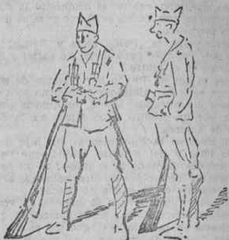
Legionarios esperando el embarque en el puerto de Melilla

Un moro que se hallaba en Morro Nuevo, al