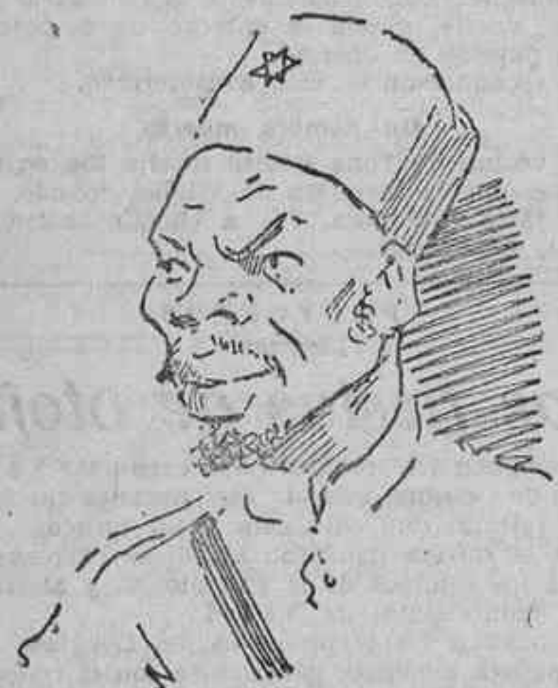
Soldado de la mehalia