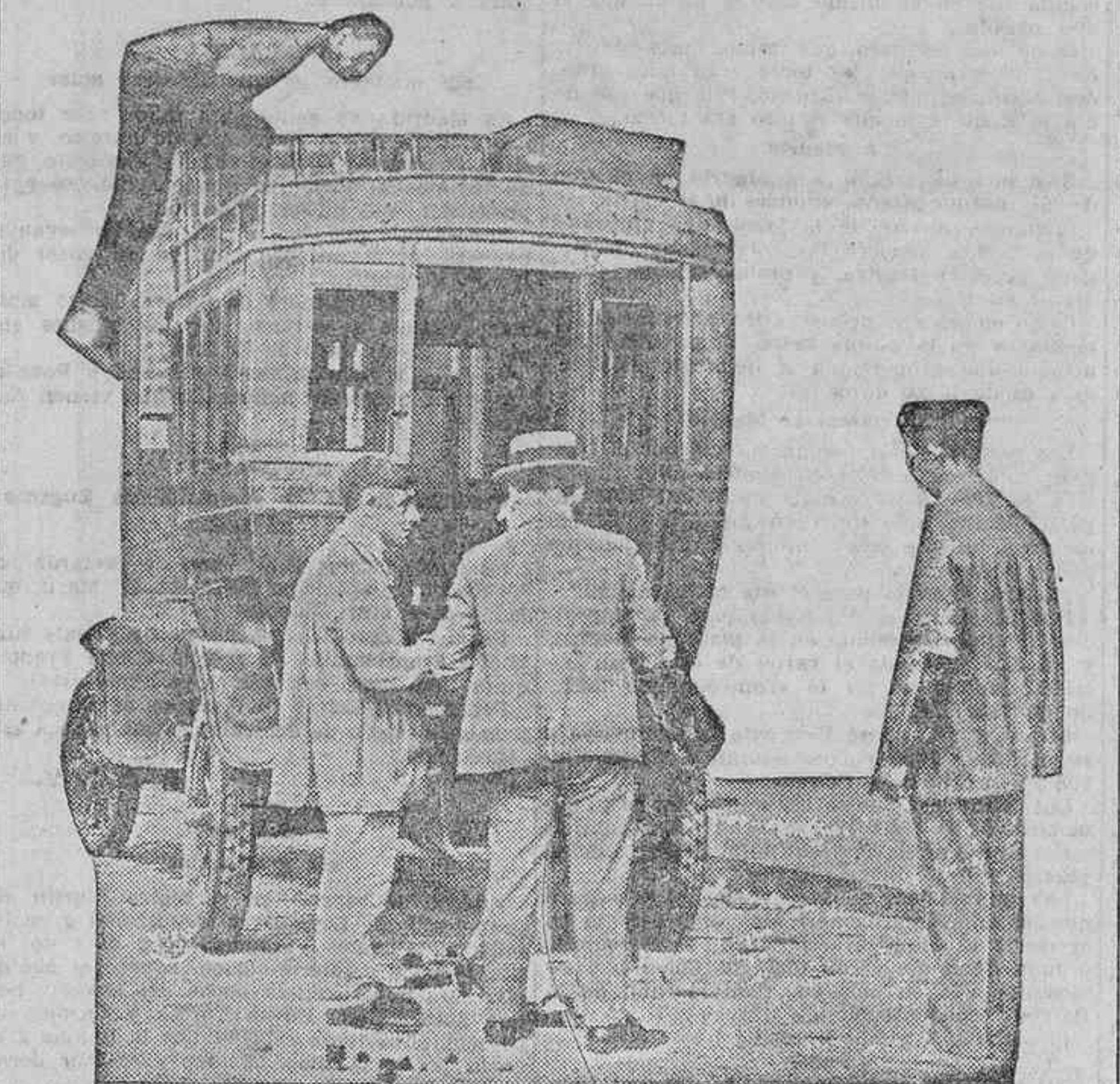
HUYENDO DEL HORNO MADRILEÑO

En vista de estas manifestaciones, la Guardia civil procedió a su detención, poniéndola a disposición del juez de instrucción, ante quien deberá explicar cumplidamente sus manifestaciones. Continúan haciéndose comentarios favorables a la Guardia civil por este servicio que, como ayer dijimos, adora muchísimos los misteriosos robos que con tanta frecuencia se cometen en los muelles de la estación de Atocha, y tal vez los que también se cometen en los de otras estaciones.