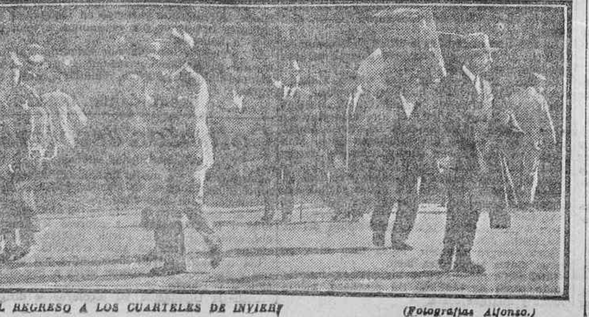
EL REGRESO A LOS CUARTELES DE INVIERNO

En Septiembre se inicia el regreso del verano.