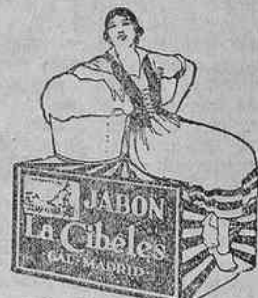
ES EL DESCANSO DE LA LAVANDERA

De venta en droguerías, perfumerías, bazares, mercerías y tiendas de comestibles