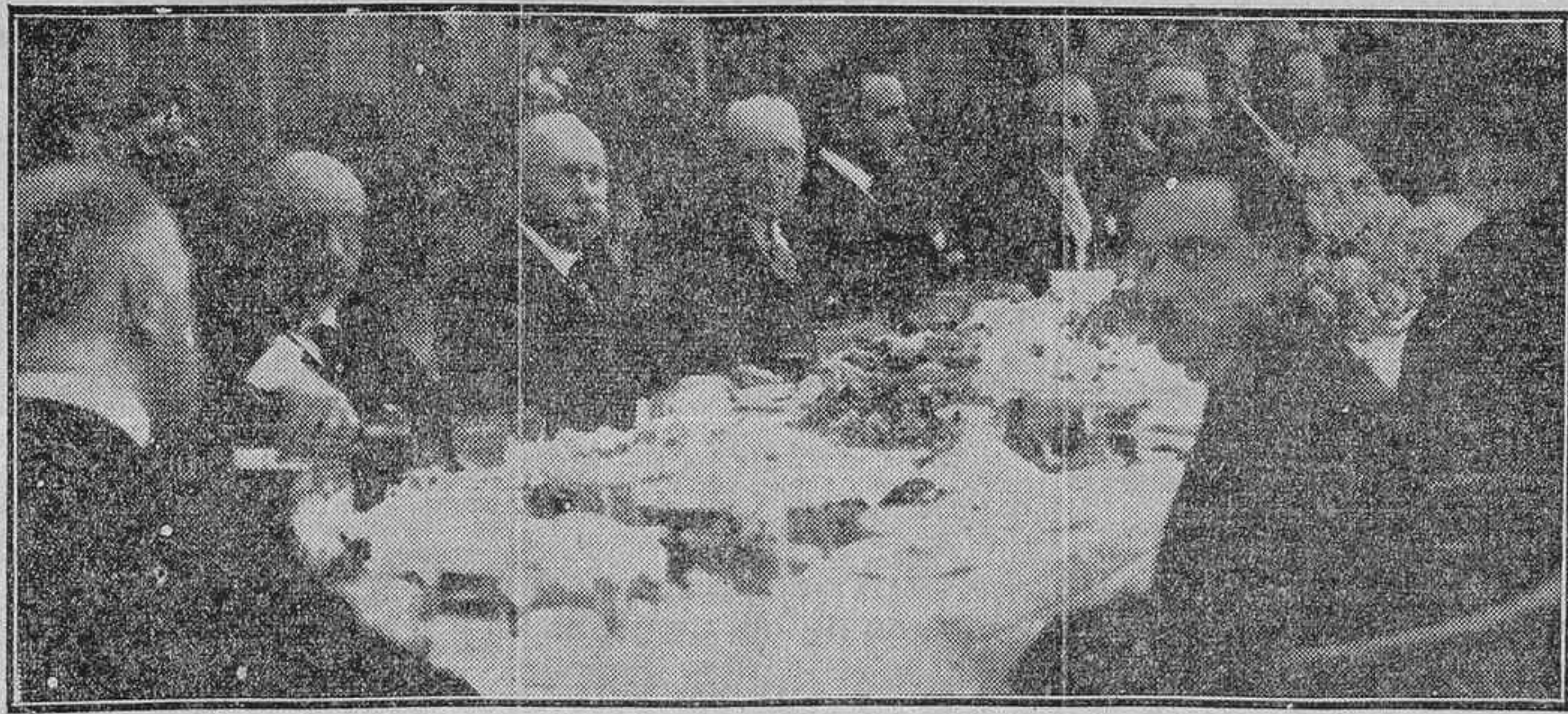
BANQUETE OFRECIDO AYER EN LA ROSALEDA DEL RETIRO POR EL AYUNTAMIENTO A LOS DELEGADOS DE LA CONFERENCIA FRANCOESPAÑOLA QUE SE CELEBRA ACTUALMENTE EN MADRID